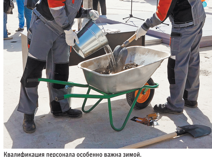
Квалификация персонала особенно важна зимой.

Сейчас «высоким сезоном» в строительстве считается теплый период года. В это время спрос на цемент резко возрастает, что иногда приводит к сложностям с его доставкой покупателям. Сезонность накладывает отпечаток как на график производства и ремонтов, так и на функционирование мощностей, отмечают в «Союзцементе». Сгладить проблему может