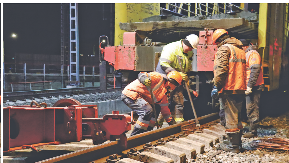
Процесс демонтажа старого железнодорожного пути