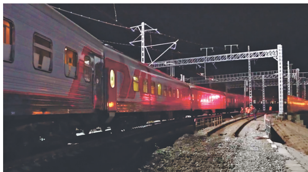
Первым по новой железнодорожной ветке 19 ноября проследовал пассажирский поезд Томск – Адлер