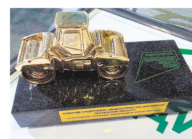
Шестой по счету «Золотой коток» – в копилке наград команды Пензенской области