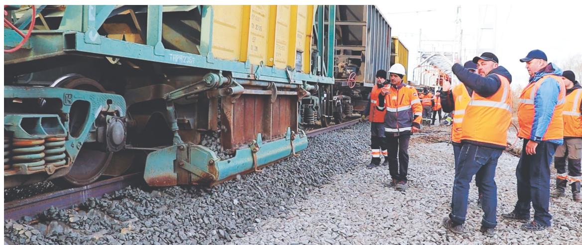
Выравнивание пути перед пуском поездов

«Этот этап был непростым. Потребовалось вносить целый ряд корректировок по ходу работ, проводилось много согласований. Работа была очень