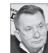
Александр Гришаев, министр строительства и дорожного хозяйства Пензенской области:

«Сегодня в регионе реализуется большое количество проектов по развитию инфраструктуры, благоустройству территорий и строительству жилья. На данный момент существует ряд механизмов, который позволяет говорить о перспективе наращивания темпов в их реализации. Создаются новые социальные объекты, модернизируется система ЖКХ, формируется комфортная городская среда и обеспечивается транспортная доступность».