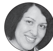
Автор: Елена СВЕРДЛОВА

По темпам строительства жилья Пензенская область оказалась на первом месте в Поволжье. Хоть цены и кусаются, пензенцы решают жилищный вопрос с помощью ипотеки