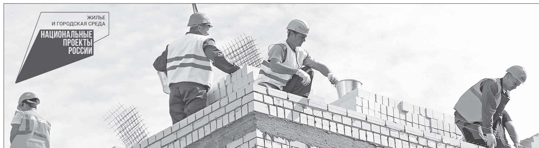
Люди хотят жить в благоустроенных микрорайонах. И выбирают квартиры там, несмотря на то, что расплачиваться за них придется не один год

●●● Самая действенная мера — строительство инженерной инфраструктуры за счет средств бюджета. Это позволяет региональным застройщикам осваивать перспективные площадки.