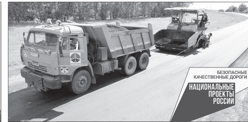
К 2027 году в нормативное состояние должны привести 85 процентов дорог в регионе

В 2023 году в рамках данного проекта финансируется строительство шести объектов. Общий объем средств — почти 1 млрд рублей, субсидия из фе-