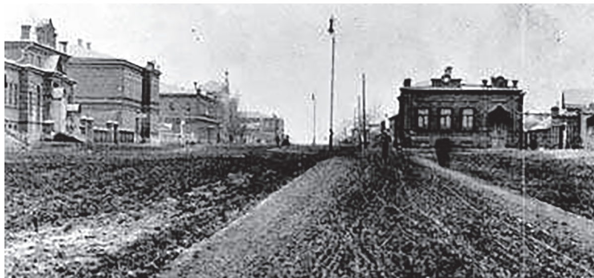
Улица Степная, ныне улица Шевченко.