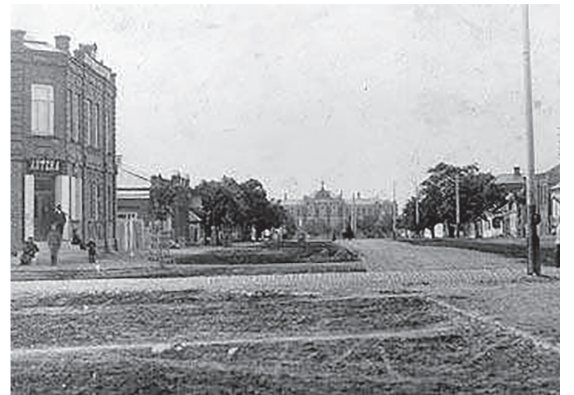
Улица Садовая, ныне улица Пушкина.