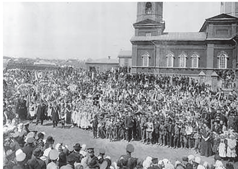
г. Александровск - Грушевский, Соборная площадь.

Атаману Платову наказали ехать в столицу и добиваться у Государя Императора разрешения на перенос казачьей столицы на избранное место. Платов добился аудиенции.