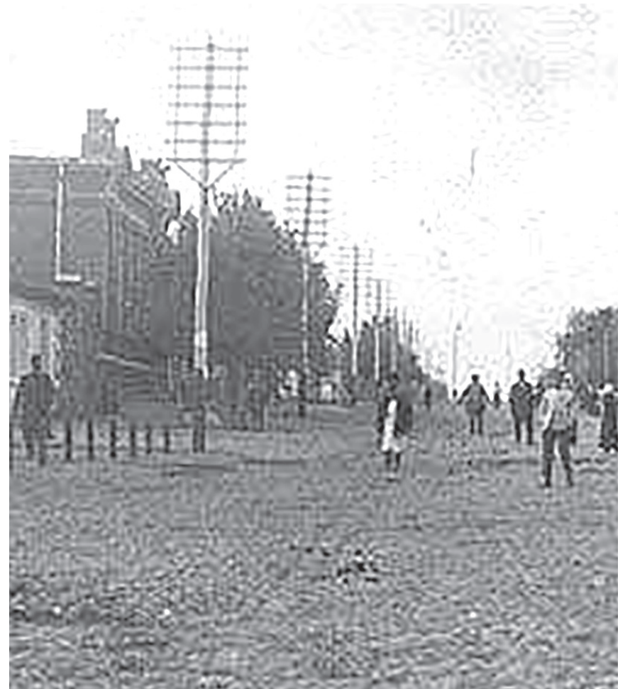
г. Александровск - Грушевский, первая улица.