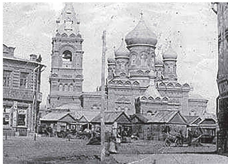
г. Александровск-Грушевский, Рыночная площадь.