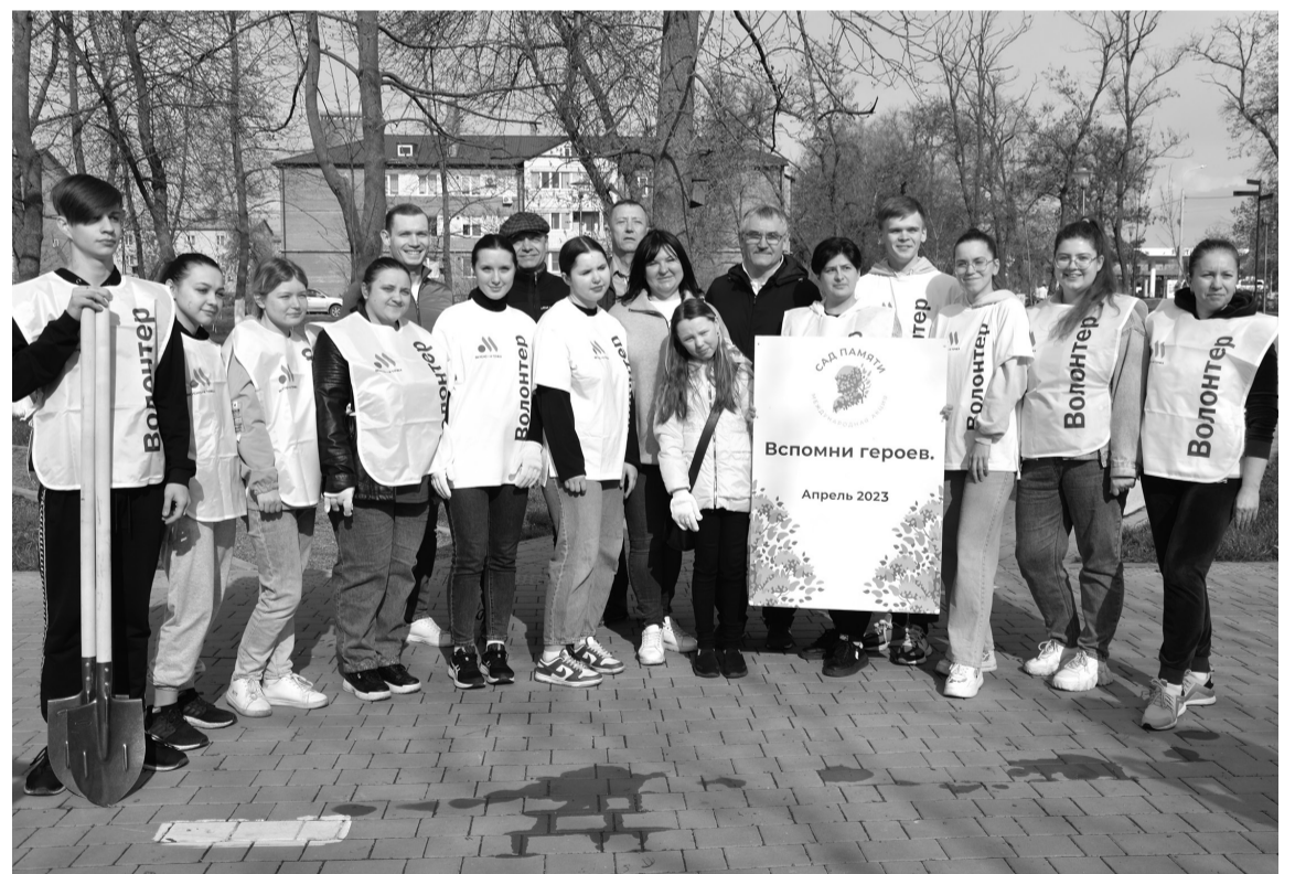
Поддержали акцию и сотрудники ресторана быстрого питания «Вкусно - и точка».

- Благодарен всем, кто не на словах, а на деле, вооружившись граблями, вениками, лопатами, поддерживает общегородскую акцию благоустройства!