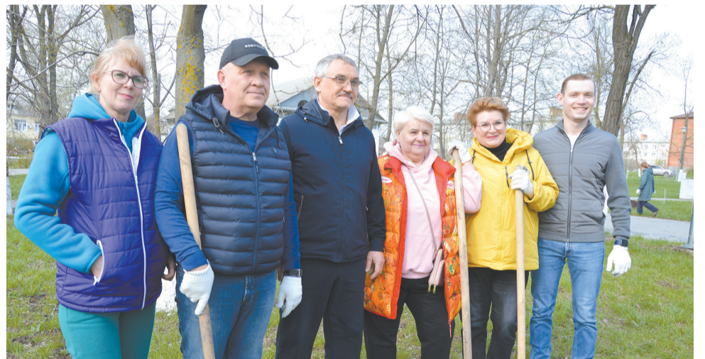
Свою лепту в высадке саженцев внесли члены Общественной палаты г. Шахты.