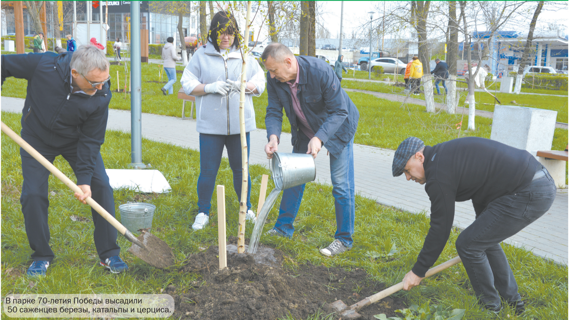
В парке 70-летия Победы высадили 50 саженцев березы, катальпы и церциса.