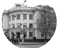
Город наш события города в цифрах