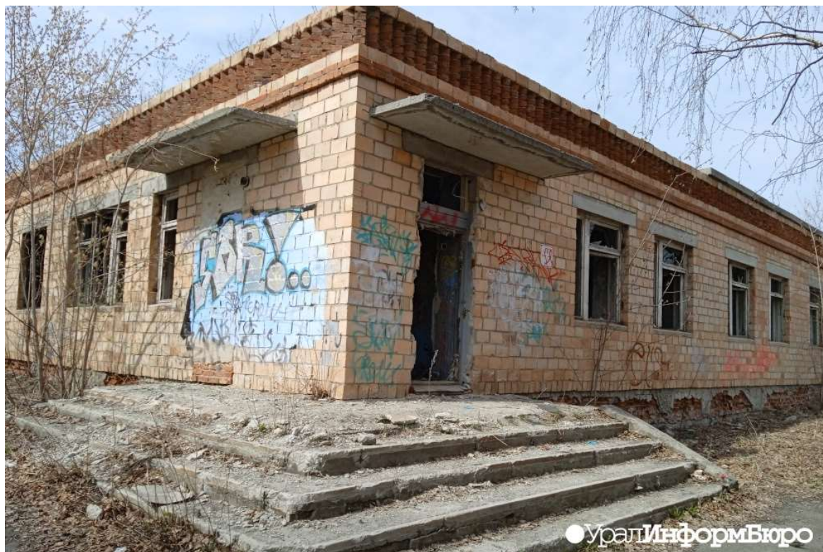
Руины поликлиники в микрорайоне Изоплит

Сегодня от бывшего великолетия остались одни руины: завод закрылся еще в 60-х годах, совхоз приказал долго жить десять лет назад. Последними "умерли" поликлиника и клуб, их кирпичные остовы теперь прибежище для бомжей.