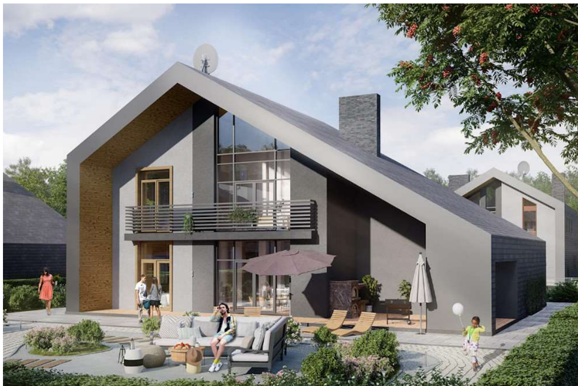
Современный коттеджный поселок в представлении застройщика "Золотого камня".

Однако реализации модели малоэтажного КРТ мешают отсутствие планов развития и модернизации объектов коммунальной, транспортной и социальной инфраструктуры на таких территориях, слабый интерес со стороны застройщиков и кредитных организаций и отсутствие единых стандартов строительства малоэтажных жилых объектов, подчеркивает Глушков.