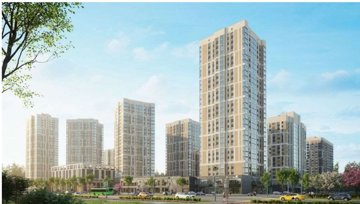
ЖК "Изумрудный бор".

Первый жилкомплекс расположен на северной границе Екатеринбурга. Еще недавно эта территория была пустошью с редкими вкраплениями частных домиков и ветхой промзоны. Теперь это полноценный жилой микрорайон с новыми улицами и развитой коммерческой инфраструктурой, в стадии строительства – школа-трансформер на 1 100 мест. Еще один важный бонус "Изумрудного Бора" – близость к трамвайной линии "Екатеринбург-Верхняя Пышма", в создании которой также участвовали структуры УГМК.