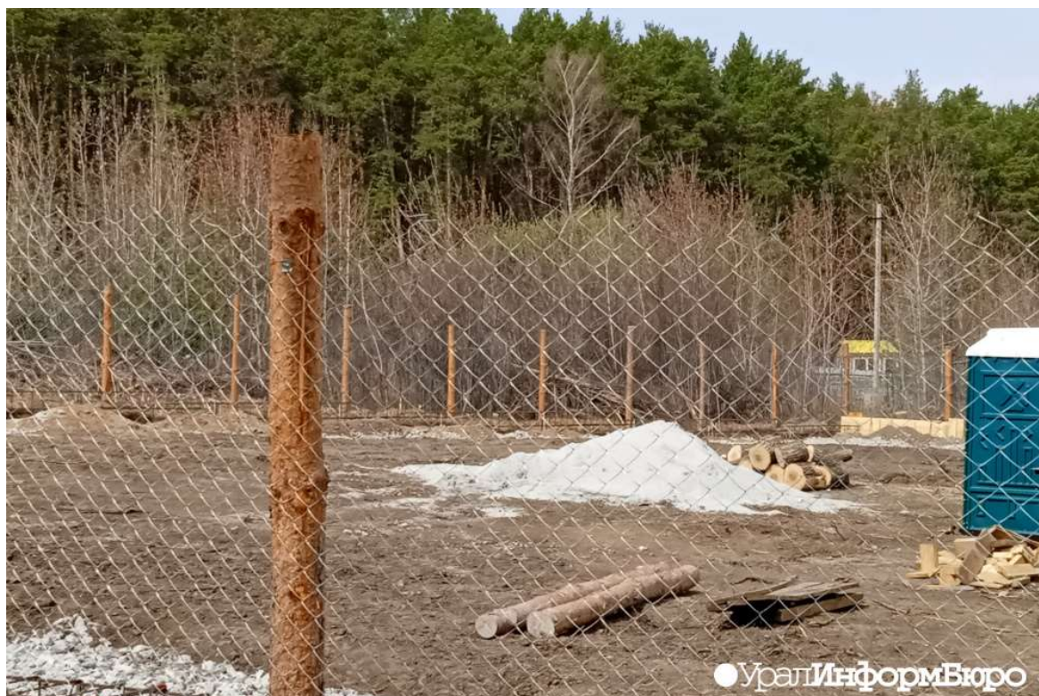
Стройплощадка нового коттеджа на улице Изоплитной