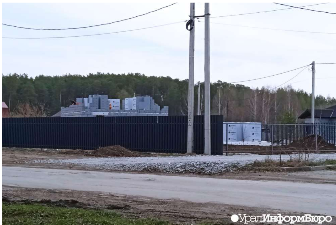
Стройплощадка "Золотого камня" в апреле 2023 года