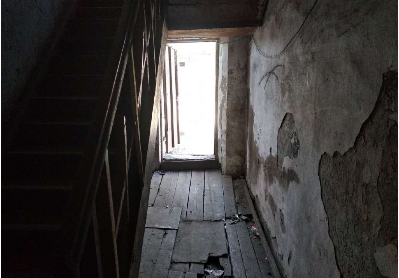
Дом по улице Некрасова, 15б.

время дом непригоден для проживания — в августе от фундамента вдоль стены пошла трещина, здание повело. В довесок прогнившие трубы устроили нам коммунальную аварию, первый этаж затопило. Аварийные службы откачивали воду, но первые морозы показали, что жить в доме невозможно. Поэтому соседи разъехались кто куда — к родственникам либо на съемное жилье. Я поселилась в садовом домике на дачном участке.