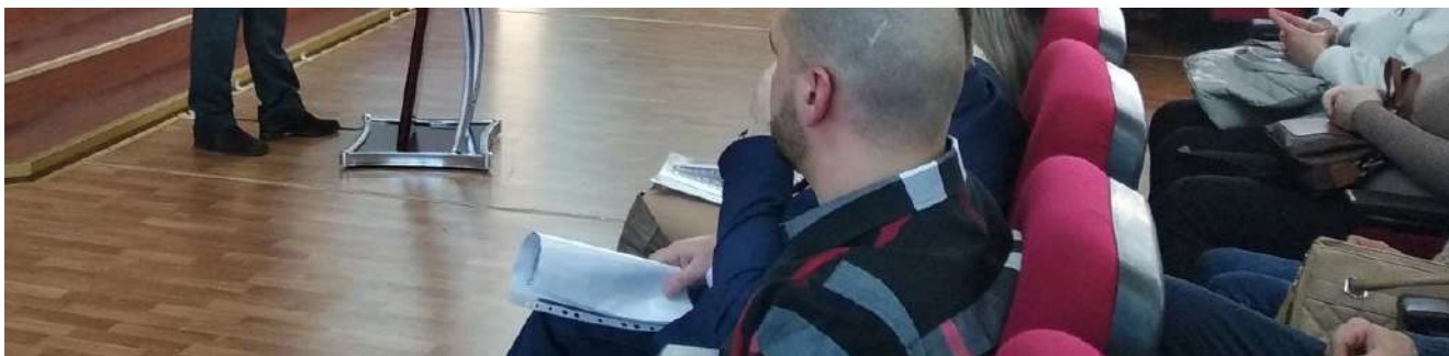
Торжественная церемония вручения ключей.