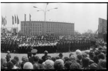
Площадь Уссурийска в 1975 году.

Что изменилось на площади после ее строительства? Вот фотография Уссурийска в 1975 году. Памятника Борцам за власть Советов еще нет. Как нет и каких-либо зданий вокруг городской администрации (тогда горисполкома).