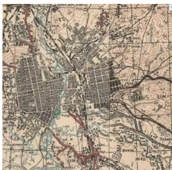
карта 1941 года.

То же самое показывает и карта, датированная 1941 годом.