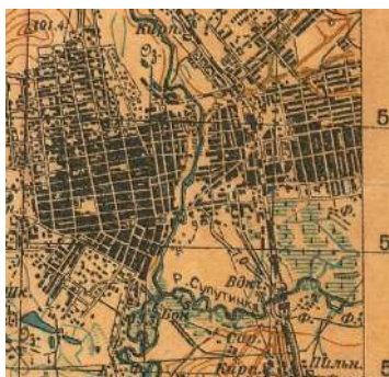
Карта 1939 года.

Карта за 1939 год тоже ясно дает понять — центральную площадь еще не построили.