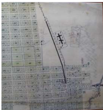
Карта 1896 год.

В 1896 году мы видим площадь, но Сенную, которая находилась там, где сейчас парк ДОРА и стадион. Долгие годы на различных фотографиях фигурирует именно эта площадь как место проведения различных городских праздников.