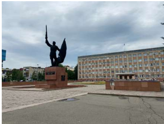
Современный вид площади Уссурийска