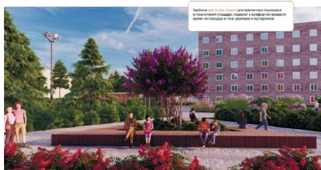
Проект площади. Фото: скриншот проекта