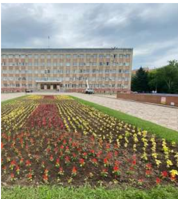
Современный вид площади Уссурийска.

С тех пор центральная площадь Уссурийска практически не менялась. В начале 2000-х по двум сторонам от памятника установили два ковша с фонтанами. Живые декоративные кустарники в одно время поменяли на искусственные деревца с подсветкой, но затем вновь вернулись к зеленым насаждениям. На пешеходных дорожках, ведущих к крыльцу административного здания, стоят лавочки для отдыха жителей.