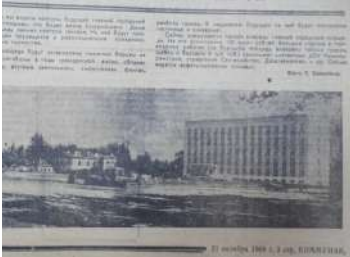
Газетная вырезка за 1969 год.

Вот фотография, демонстрирующая активную фазу строительных работ. И текст: