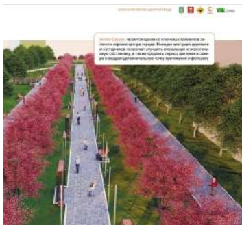
Аллея сакуры.

Буквально новая жизнь закипит в сквере по Пушкина, 50. В планах построить игровую и спортивную площадку, полукруглый теневой навес с качелями, установить уличную библиотеку и обустроить парковку.