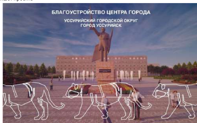
Проект площади.

Интересное предложение по созданию настоящей аллеи сакуры. Красивоцветущие деревья могут стать еще одной достопримечательностью города. Здесь также будет аллея для отдыха и стоять туалетные модули.