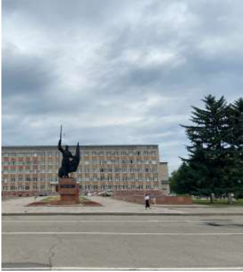
Современный вид площади Уссурийска.

Сейчас памятник стал лицом Уссурийска, его изображают на магнитах и других сувенирах.