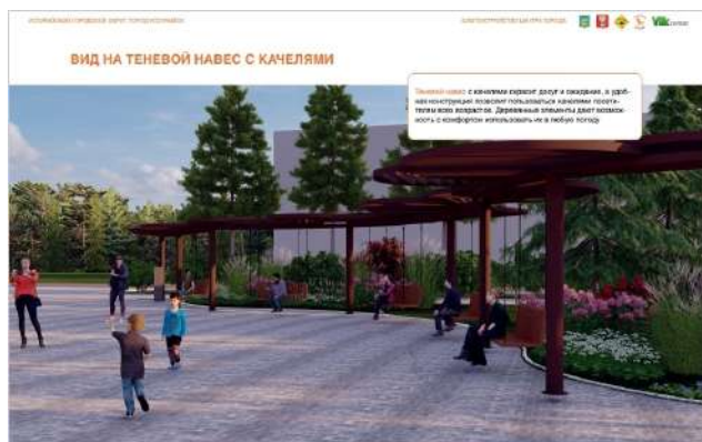
Проект площади. Фото: скриншот проекта

Вот что предлагают сделать дизайнеры на центральной площади. За памятником Борцам за власть Советов вместо чаш с фонтанами установить большой "сухой" пешеходный фонтан. Для отдыха людей обустроить специальную зону, а также сделать теневой навес с качелями со стороны улицы Октябрьской. Асфальтированная часть на площади по замыслам разработчиков сократится: асфальт заменит брусчатка.