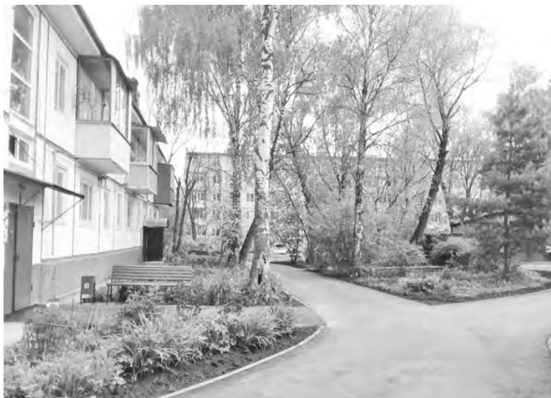
Благоустроенный двор дома № 16 по ул. Пролетарская

Средства из бюджета могут быть направлены на финансирование работ по благоустройству