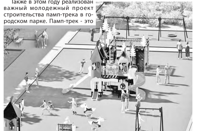
Проект общественного пространства между домами № 7 и № 14 в мкр. «Южный»