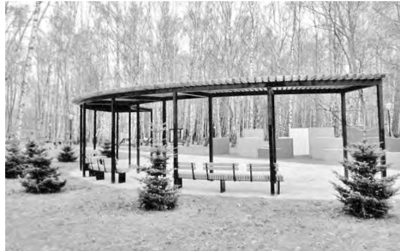
Новый облик городского парка

Ремонт дворовых проездов из минимального перечня работ предусматривает, в том числе, устройство водоотводных лотков, замену бордюрного камня, подъем колодцев, корчевку пней, удаление расположенной в пределах ремонтируемой проез-