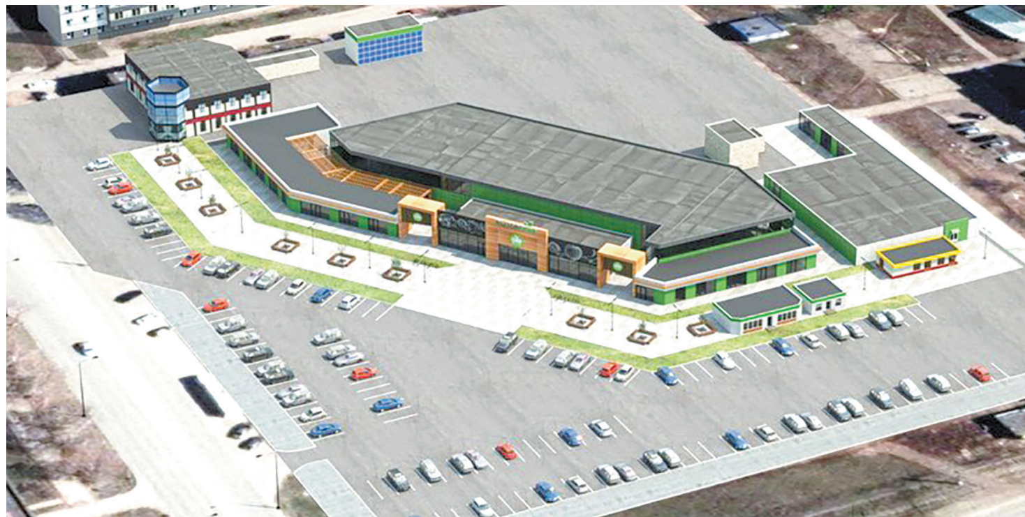
Примерный макет будущего обновленного Бызовского рынка

«В будущем подразумевается строительство кампуса, рядом с этим зданием впоследствии появится студенческое общежитие и совмещенно пристроим столовую. В целом еще будет единое благоустройство, появятся спортивные площадки и зона для