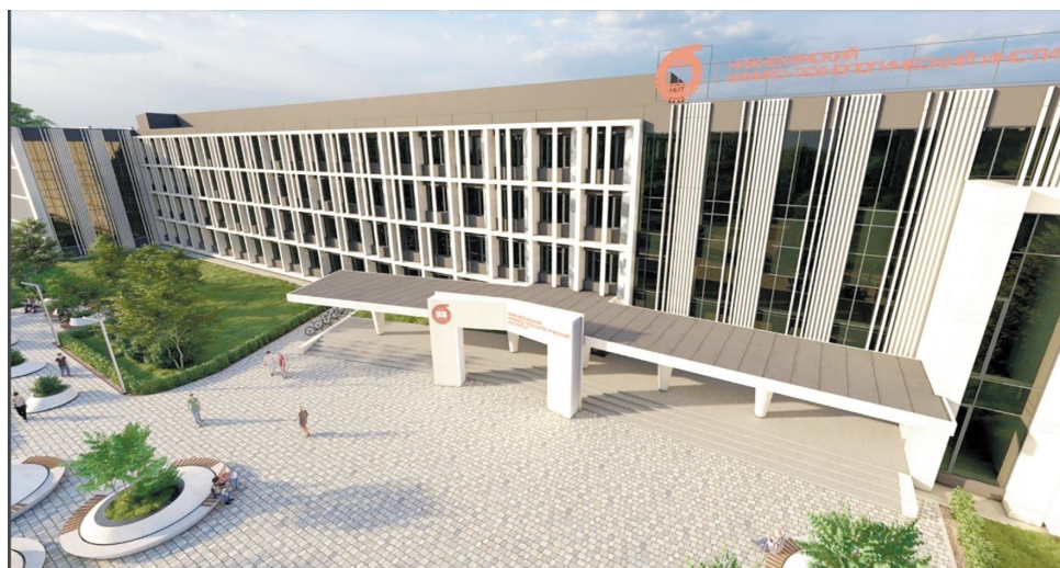
Здание НХТИ и прилегающую к нему территорию обновят впервые за 38 лет.