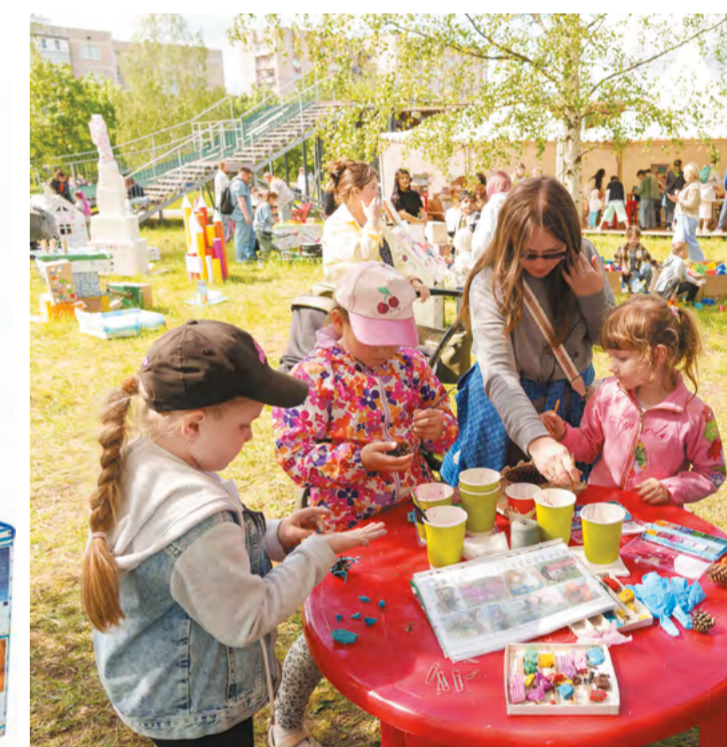
Участие в мастер-классах подарило детям много радости и возможность помечтать, проявить творчество