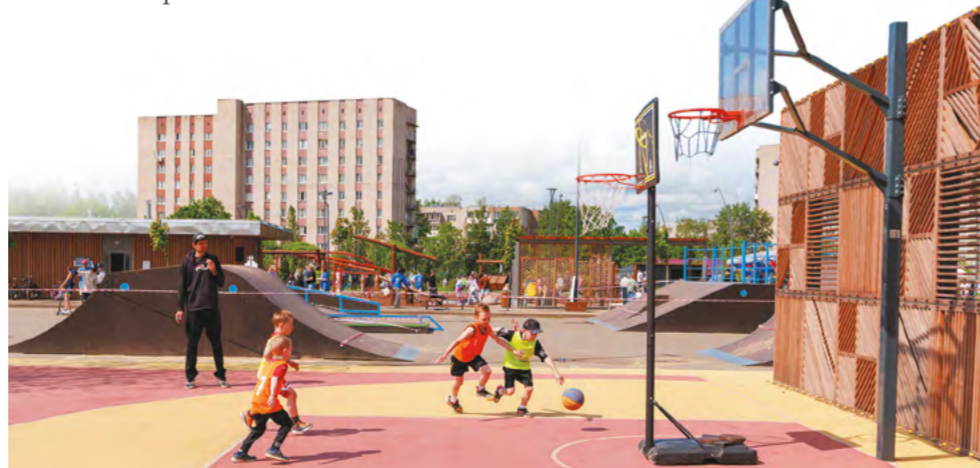
«Безопасный город» включил в себя 10 тематических площадок, одна из них была посвящена безопасности во время занятий спортом

– Спасибо, что Калининская АЭС организовала такой праздник. Много полезной информации и интерактивных площадок. Это актуально для любого возраста. Я сам полностью прослушал лекцию про правила безопасного поведения в интернете. Очень впечатлило.