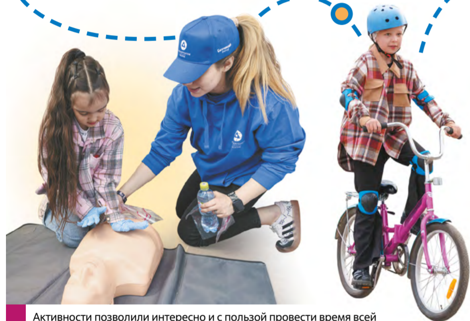
Активности позволили интересно и с пользой провести время всей семье и получить практические навыки безопасного поведения, отработать их в разыгранных ситуациях – например, научиться оказывать первую помощь

город» получился по-настоящему семейным. Тема безопасности одинаково актуальна, важна и интересна для всех возрастов. Именно поэтому в активностях себя проявили не только ребята, но и их родители, и даже бабушки и дедушки. Работу локаций организовывали эксперты и волонтеры Калининской АЭС – уполномоченные по культуре безопасности и уполномоченные по охране труда, а также представители Молодежной организации атомной станции.