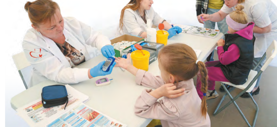
В палатке «Диагностика здоровья» сотрудники ЦМСЧ № 141 всем желающим могли провести экспресс-диагностику, измерив давление, определив уровень сахара в крови и другое

Если для подростков урок ОБЖ фактически «вышел» из стен школы, то для ребят помладше многое и вовсе было вновь. Как распознать мошенников и не попасться на их уловки, как оказать первую помощь – наложить повязку, провести искусственную вентиляцию легких, оказать помощь, если человек пода-