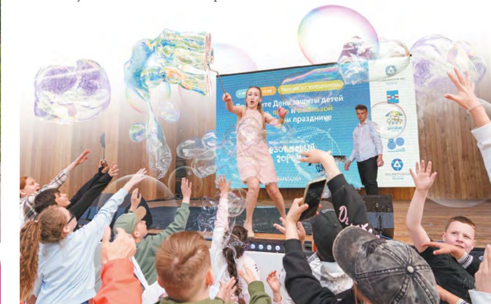
И, конечно, какой же праздник детства без воздушного сладкого облака из сахарной ваты, аквагрима и шоу мыльных пузырей

– К теме безопасности отношусь серьезно. В настоящее время для меня самое важное – это информационная безопасность. Мое поколение много времени проводит в интернете, поэтому мне было полезно получить знания от экспертов в этой области.