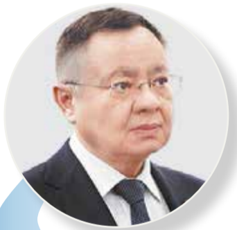
Ирек ФАЙЗУЛЛИН, министр строительства и ЖКХ РФ:

С развернутым обзором состояния дел в ЖКХ выступил глава Минстроя России Ирек Файзуллин. Он напомнил, что сегодня насчитывается 1 млн км сетей, 990 тыс. многоквартирных домов (МКД) общей жилой площадью 2,5 млрд кв. метров, управление ими осуществляют более 64 тыс. организаций, а подачу воды и тепла в дома обеспечивают 11 тыс. ресурсоснабжающих организаций, 62 тыс. комплексов водоснабжения, 12 тыс. объектов водоотведения и 75 тыс. источников теплоснабжения.