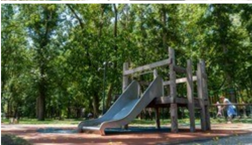
Пешеходный фонтан в парке «Кура»