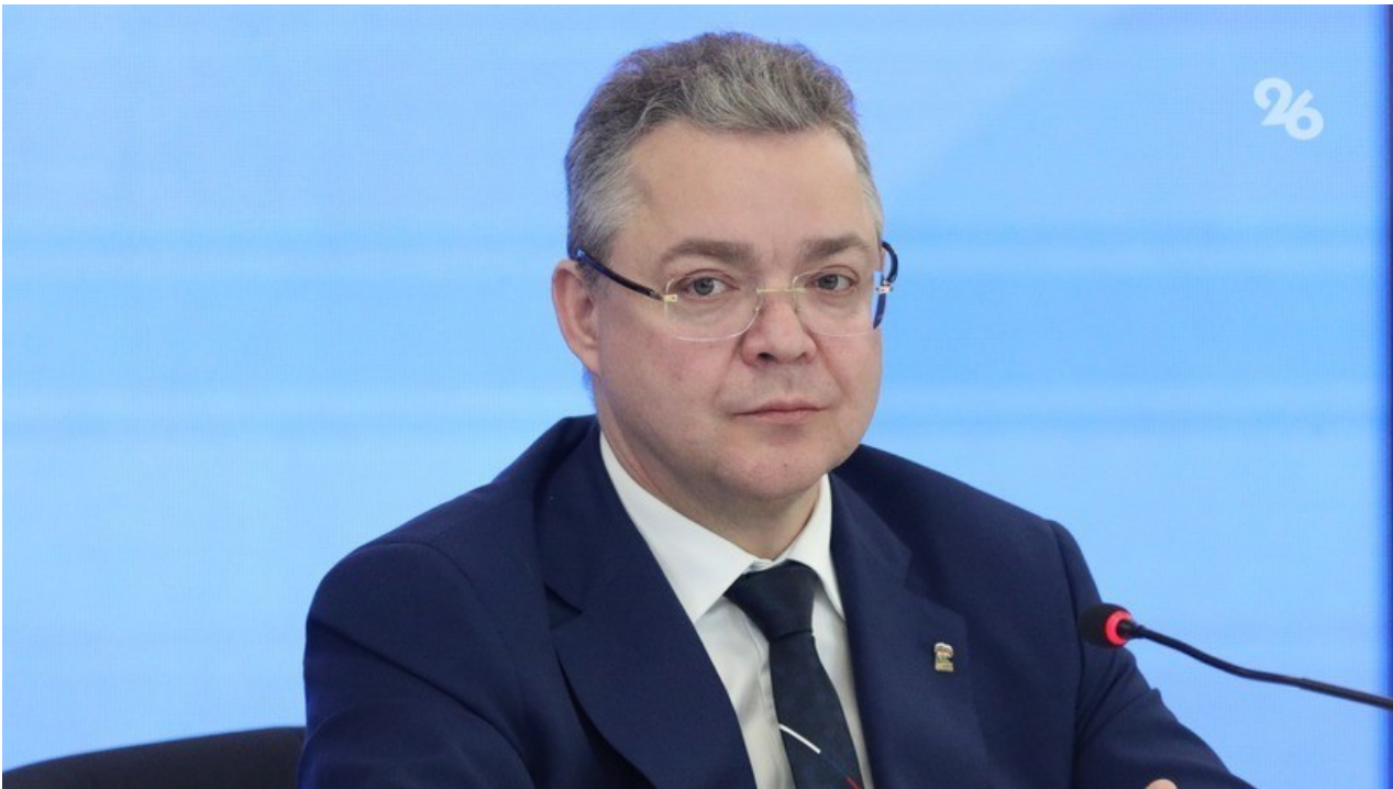
Губернатор Ставропольского края Владимир Владимиров

Глава региона неслучайно привёл в качестве примера именно парк, построенный в Кировском округе. Когда в 2020 году проект его создания вошёл в число 160 победителей Всероссийского конкурса, пойма Куры вряд ли кому-то могла показаться благоустроенной. Работы по созданию парка начались сразу же после получения грантовых 150 млн рублей и завершились в конце 2021 года.