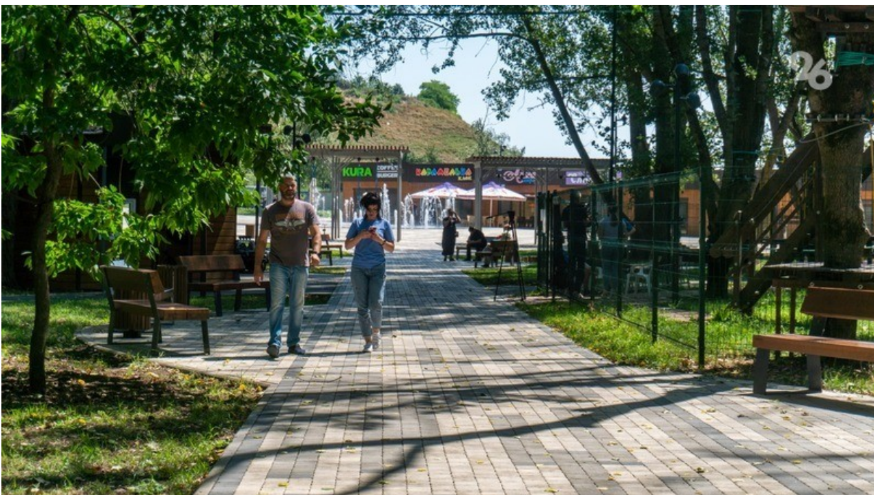
Парк сразу полюбился жителям Кировского округа

Глава региона неслучайно привёл в качестве примера именно парк, построенный в Кировском округе. Когда в 2020 году проект его создания вошёл в число 160 победителей Всероссийского конкурса, пойма Куры вряд ли кому-то могла показаться благоустроенной. Работы по созданию парка начались сразу же после получения грантовых 150 млн рублей и завершились в конце 2021 года.