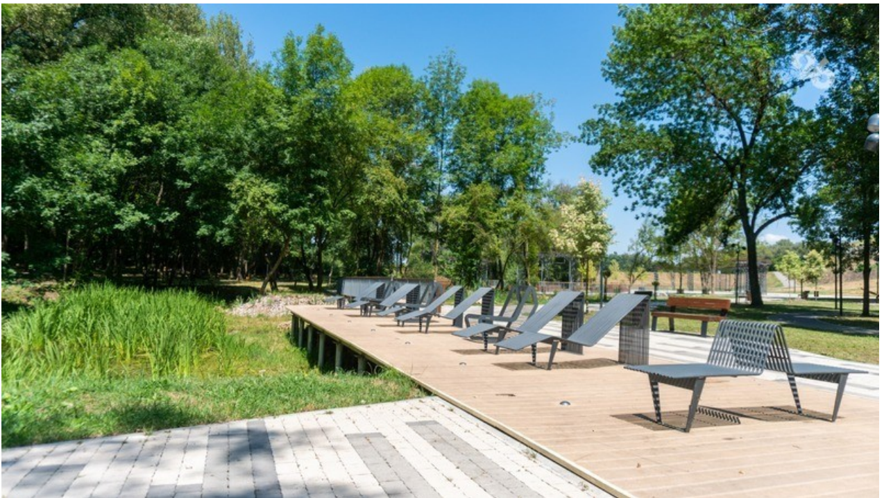
Позагорать у воды можно на шезлонгах

Если хочется размяться — в парке есть зона воркаута и верёвочный парк, зона для занятий йогой и фитнесом, а для детей обустроили качели и аттракционы. Гости также могут прогуляться по аллеям — послушать, как журчит вода, позагорать в шезлонге или устроить пикник в специально оборудованной зоне.