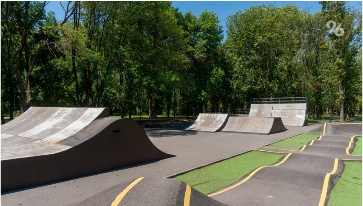
На территории парка оборудованы памп-трек и скейт-парк

Если хочется размяться — в парке есть зона воркаута и верёвочный парк, зона для занятий йогой и фитнесом, а для детей обустроили качели и аттракционы. Гости также могут прогуляться по аллеям — послушать, как журчит вода, позагорать в шезлонге или устроить пикник в специально оборудованной зоне.