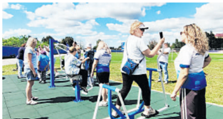
■ Новый силовой городок появился на территории стадиона к радости горожан.