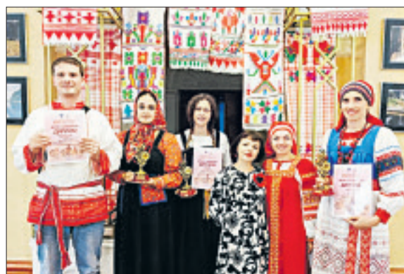
■ Яковлевские мастера достойно представили регион на фестивале в Курске.

Мастера Яковлевского муниципального округа выражают благодарность Курскому областному Дому народного творчества за приглашение и возможность продемонстрировать мастерство белгородских рукодельниц на межрегиональном уровне. Победы наших ремесленниц вновь подтвердили высокий уровень развития народных промыслов в Белгородской области.