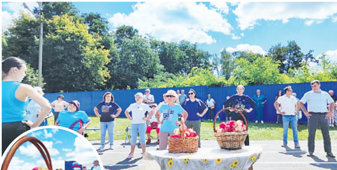
■ Для всех собравшихся прошла зарядка с чемпионом.

Инфраструктура. В Строителе открыли силовой городок на стадионе по улице Мира