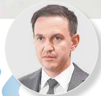
Ильшат ШАГИХМЕТОВ, генеральный директор Фонда развития территорий:

Перед нами поставлены амбициозные задачи по восстановлению и социально-экономическому развитию новых регионов. Первоочередная из них — обновление коммунальной инфраструктуры