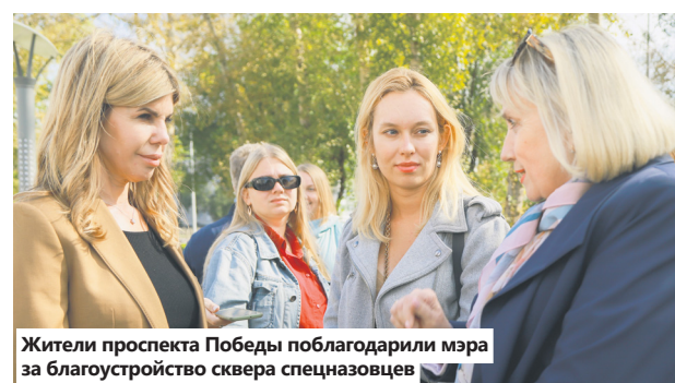
Жители проспекта Победы поблагодарили мэра за благоустройство сквера спецназовцев

В ближайшее время в детский сад привезут мебель и необходимое оборудование. Благоустройство территории уже идёт. К середи-