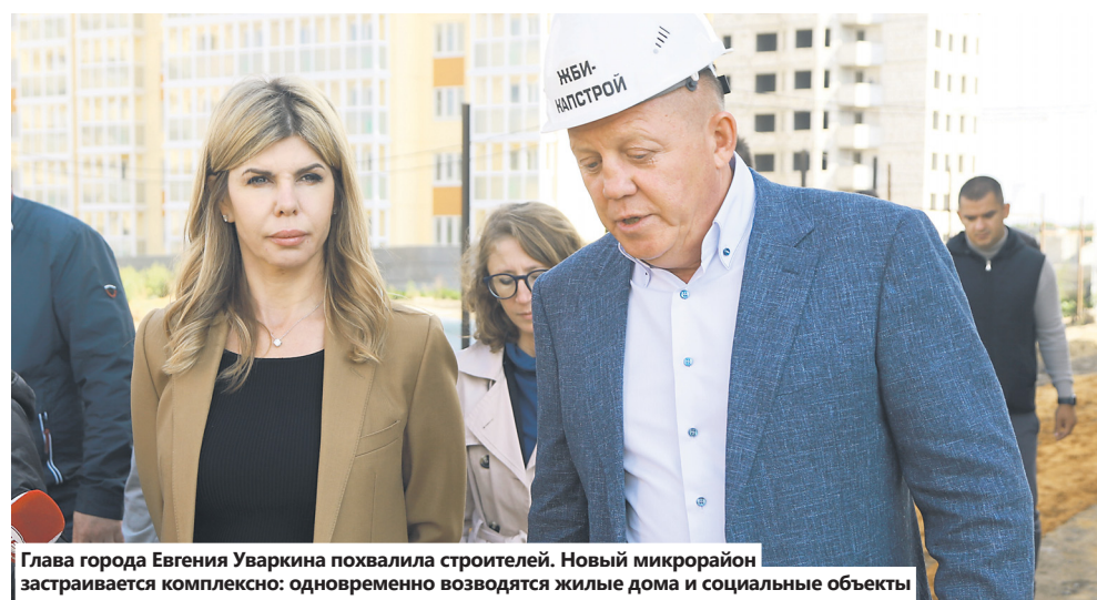
Глава города Евгения Уваркина похвалила строителей. Новый микрорайон застраивается комплексно: одновременно возводятся жилые дома и социальные объекты

Подрядчик говорит, что дома уже готовы на 90%. Сейчас ведут отделочные работы, монтируют инженерные сети, документы в Ростехнадзор планируют направить к началу октября. Согласно контрактам,