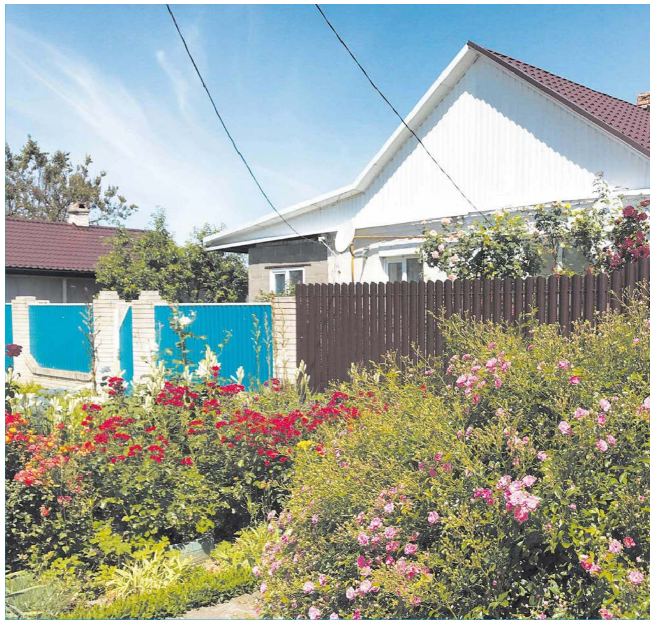
■ Жители посёлка называют Таисию Бабаеву королевой цветов. I место. / ВСЕ ФОТО: НИНА ВОРОНОВСКАЯ.

На огромной угловой территории домовладения №26/2 фиолетовый клематис на опоре в виде сердца, по соседству