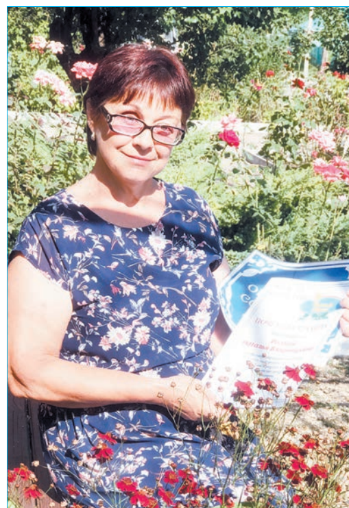
© Таисия Бабаева, Алла Трускал и Наталья Роговая - победительницы редакционного проекта по пос. Заречному. / ФОТО: НИНА ВОРОНОВСКАЯ.