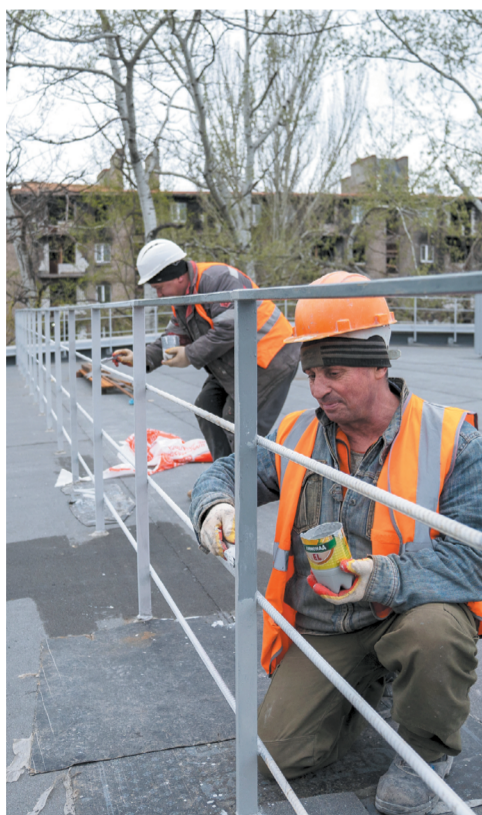
В Мариуполе работают около 500 липецких строителей

« В ГОРОДЕ ПОВРЕЖДЕНО 60–70% ЗДАНИЙ, А 20% ЖИЛЫХ ДОМОВ ВООООЩЕ НЕ ПОДЛЕЖАТ ВОССТАНОВЛЕНИЮ. СОЛДАТЫ ВСУ, ПОКИДАЯ МАРИУПОЛЬ, РАССТРЕЛИВАЛИ ДОМА ИЗ ТАНКОВ »