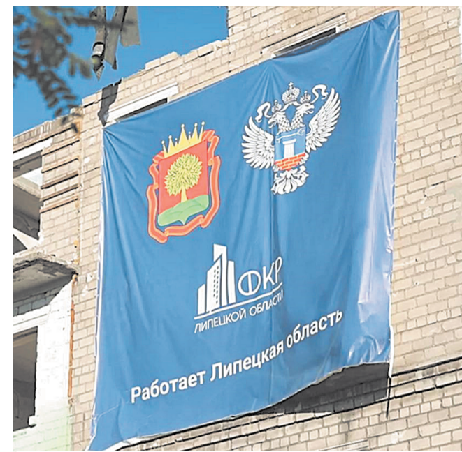
На территории города работают специалисты ФКР из 13 регионов России

В Мариуполе, рассказывают наши строители, есть проукраински настроенные горожане, надеющиеся, что над городом когда-нибудь снова поднимут украинский флаг. Местные, которым возвращаться под власть Киева не хочется, называют их «жудунами». Но «жудуны» не представляют для наших строителей никакой опасности — они даже работают в российских бригадах. Опасность представляет то, что после Великой Отечественной называли «эхом войны».