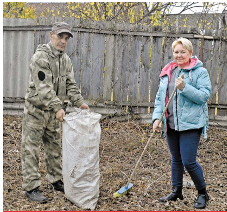
Супруги наводят порядок во дворе