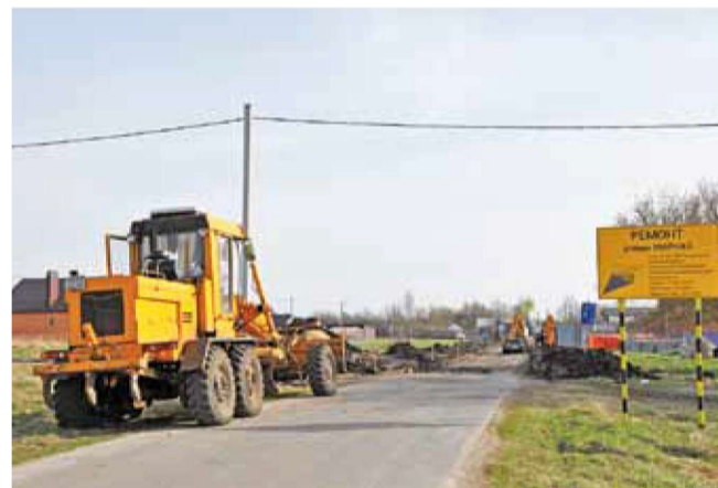
Ремонт дорожного покрытия на улице Мирной

зал, зал для хореографии и фитнеса с современными тренажёрами и оборудованием, библиотека, выездной класс Детской школы искусств города Корочи, кабинеты для кружковой работы. Большой концертный зал сможет вместить 200 зрителей. На базе культурно-спортивного центра также откроется первый в районе «Добро.Центр», который объединит волонтеров всех направлений.