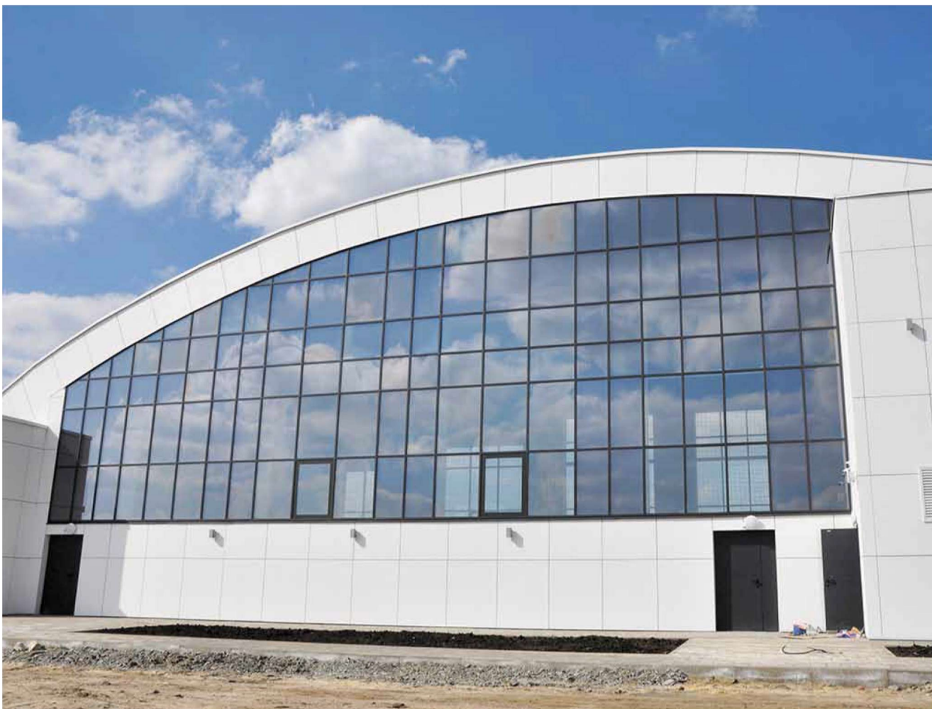
Так выглядит новый культурно-спортивный центр в с. Погореловка