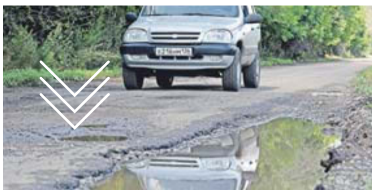
Дорогу общего пользования в трех поселениях испортили за несколько месяцев.

наж вдвое, то штраф составит уже 600 тысяч рублей. Поэтому подавляющее большинство нарушителей решило — пункт контроля надо объезжать!