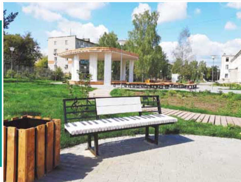
• Парк в Решетихе. Сдан в 2019 г.