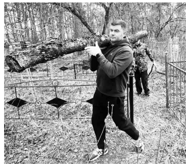
• Администрация округа наводила порядок на кладбищах