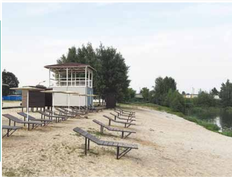
• Зона отдыха «Малбу». Открыта в 2023 г.