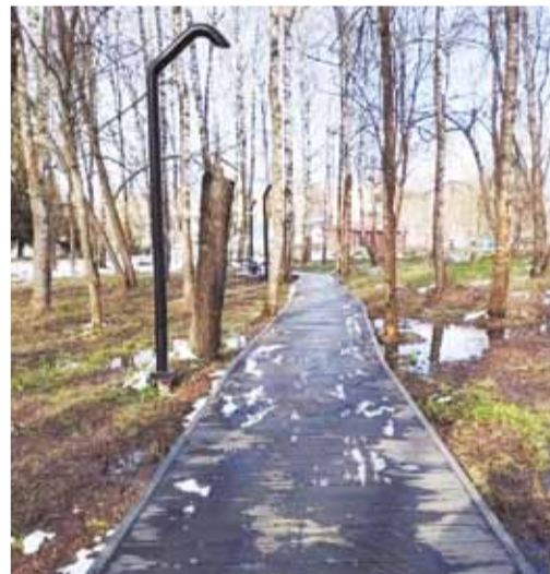
• Парк в Ильиногорске. Сдан в 2025 г.

И так каждый год Володарский округ участвует в проекте ФКГС. Семнадцатым по счёту стал центральный парк культуры и отдыха в Ильиногорске, благоустроенный в 2025 году. Работа продолжается.