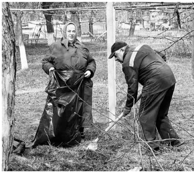
• Местные жители улицы Мичурина вышли поддержать субботник