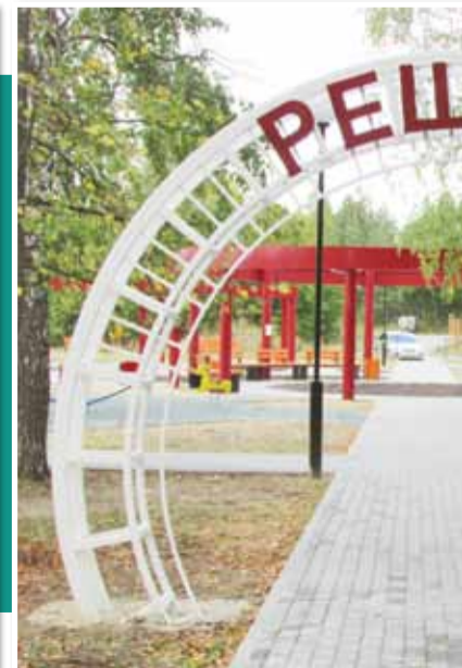
• Сквер в Решетихе. Сдан в 2020 г.