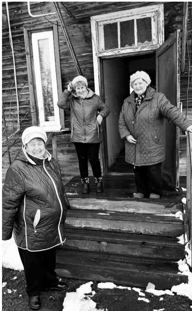
• Жильцы дома ждут долгожданного переезда