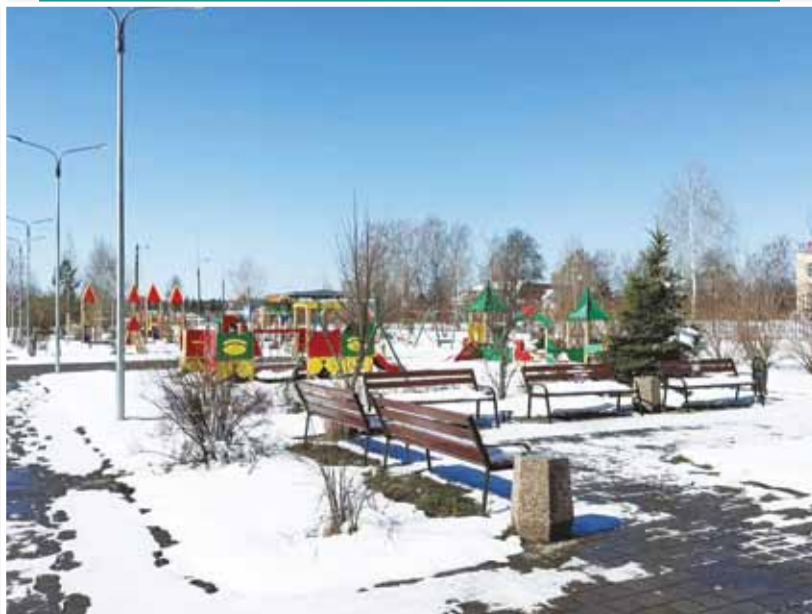
• Детская площадка в Володарске – первый объект благоустройства. Сдан в 2018 г.