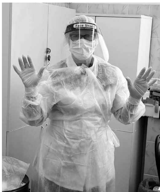
• 10 секунд – и защитный костюм надет