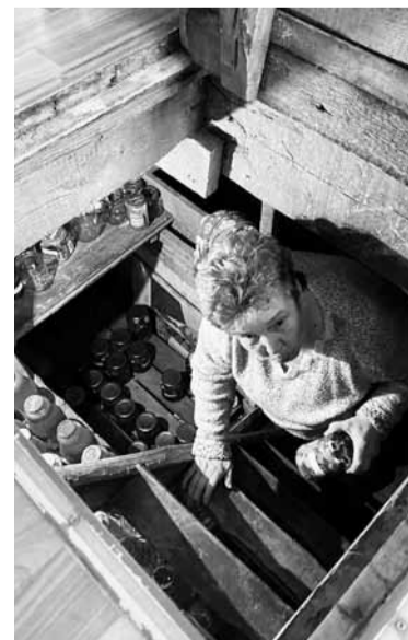
• Домашние заготовки из погреба

СПРАВКА: В строящийся многоквартирный дом № 36 на улице Мичурина в г. Володарске переселятся 14 многоквартирных домов: – 2 дома из г. Володарска по ул. Первомайской: д. 27 и ул. Южная, д. 22; – 12 домов из р.п. Красная Горка по ул. Ленина, д. №№ 39, 40, 36, 38, ул. Железнодорожной №№ 1, 2, 3, ул. Северной, д. № 1, ул. Полевой, д. № 2А и п. Гольшево, ул. Совхозной, д. №№ 5, 7, 8. Граждане получают свои новые жилые помещения в 1 квартале 2027 года.