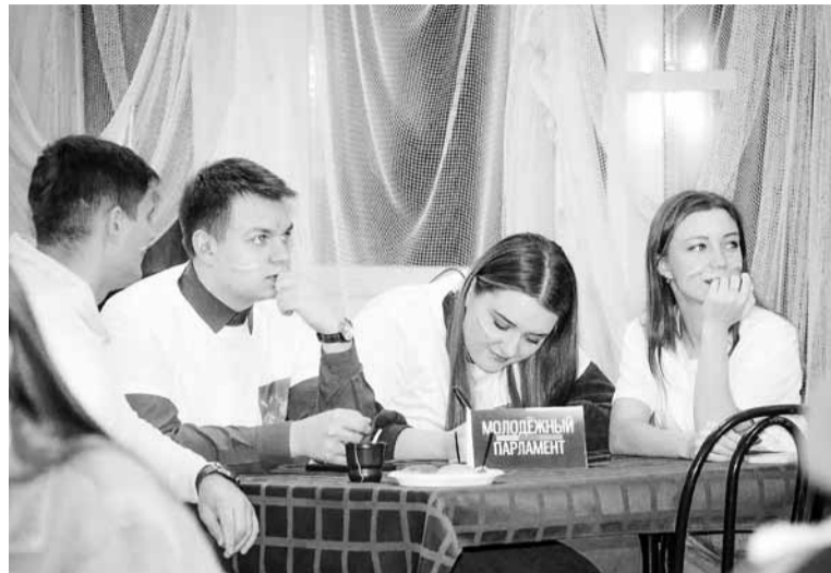
• Принимали участие в квизах