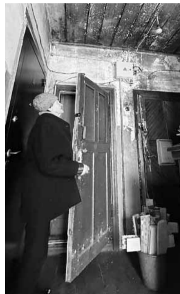
• На втором этаже дома течёт крыша