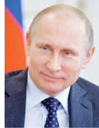
В. В. Путин, Президент РФ

21 апреля в нашей стране открыл устройства в рамках ФКГС – федеральной программы. В этом году программа продолжит д по 12 июня включительно. Миним го за один проект.