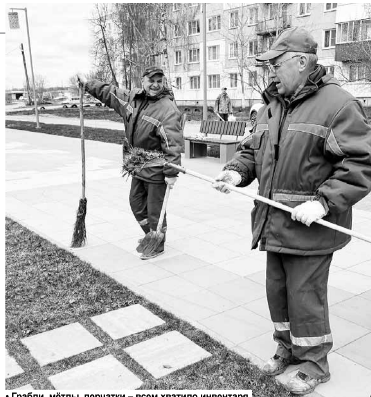
• Грабли, метлы, перчатки – всем хватило инвентаря