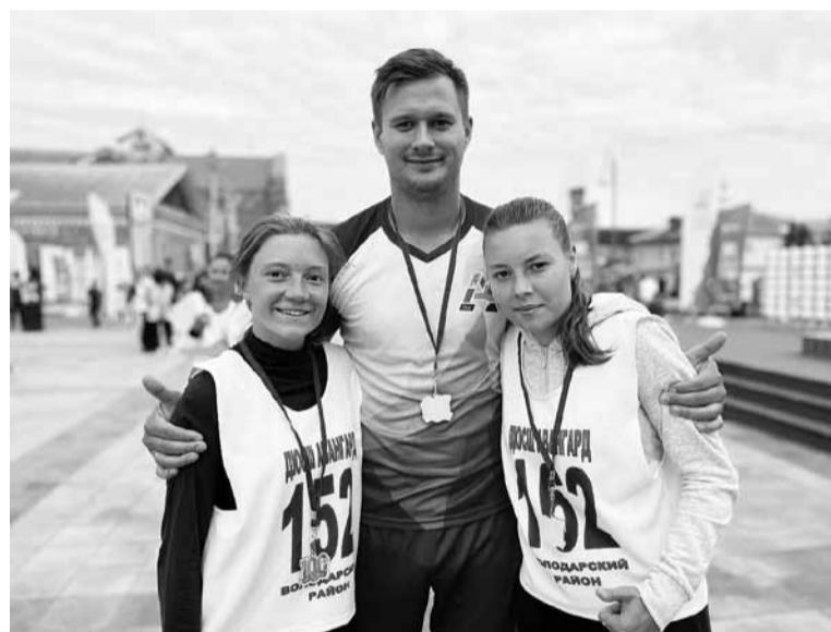
• Помогали в организации и были участниками забега «100 красивых мест Нижегородской земли»