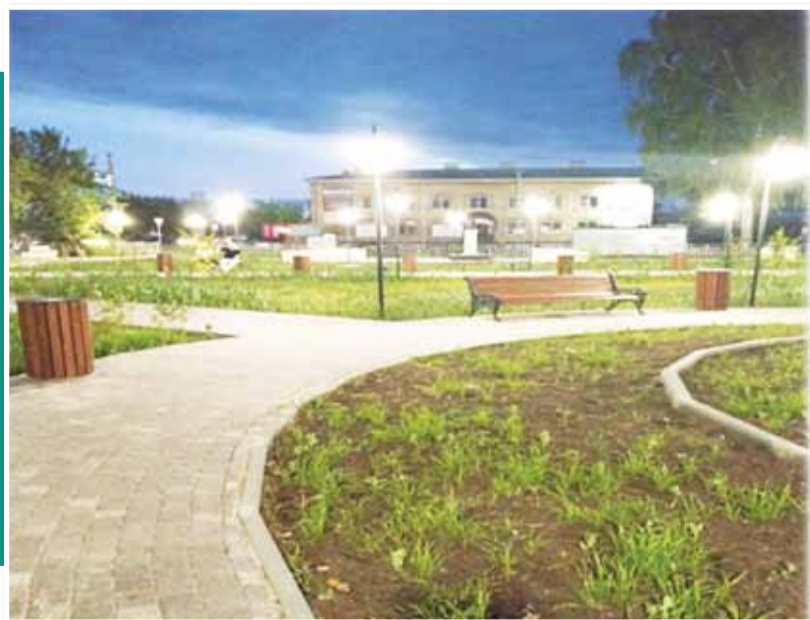
• Сквер в Володарске. Сдан в 2021 г.