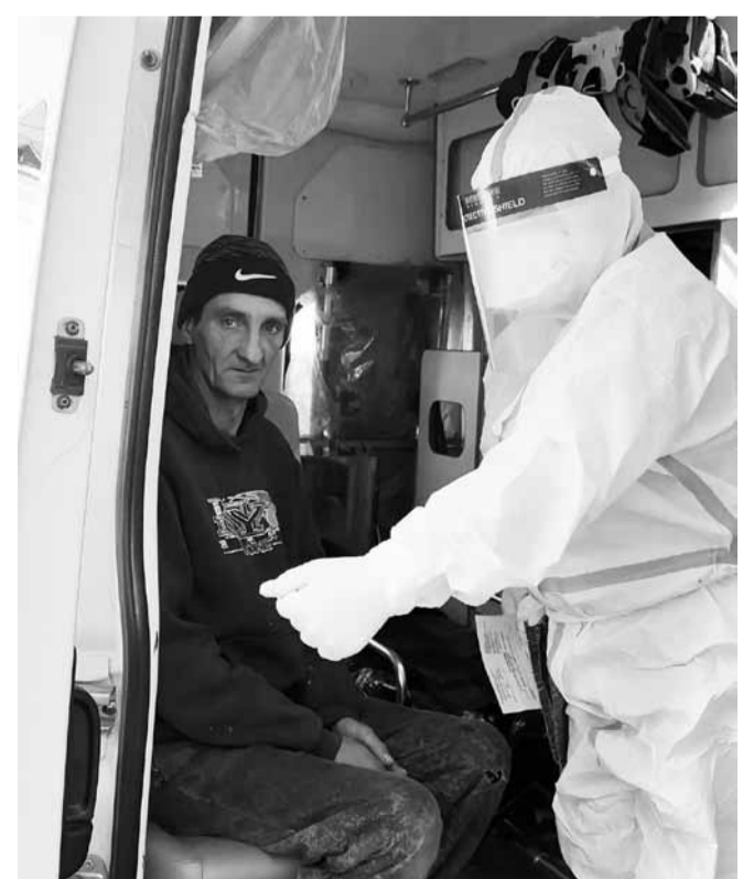
• Роль подставного пациента исполняет местный житель