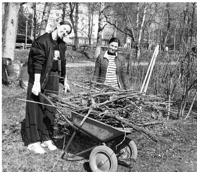
• В день субботника журналисты «Знамени» сменили профессию