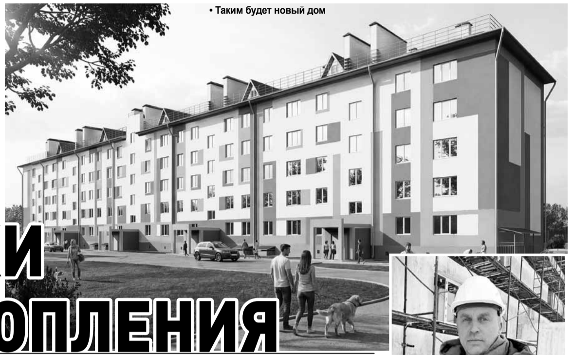
• Таким будет новый дом