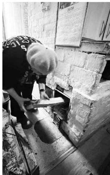
• Машина дров на зиму