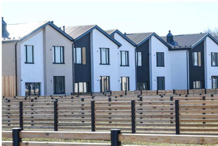
| Фото: Сергей Елесин, ИА "Тюменская линия"

Экономика, 15:04 23 июня 2023 | Версия для печати