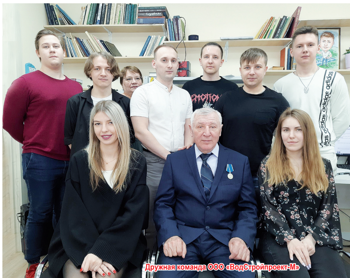
Дружная команда ООО «ВодСтройпроект-М»