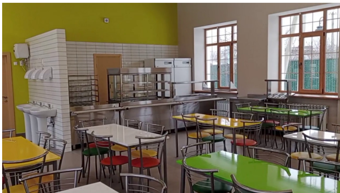
Новая столовая школы № 35.

► «Наш Белгород» рассказывает об итогах капитального строительства в областном центре на примере завершённых объектов. Как выглядят современные школы и детские сады после обновления? Что вмещают в себя новый футбольный манеж и недавно построенный Дворец спорта «Салют»? Об этом читайте в нашем материале.