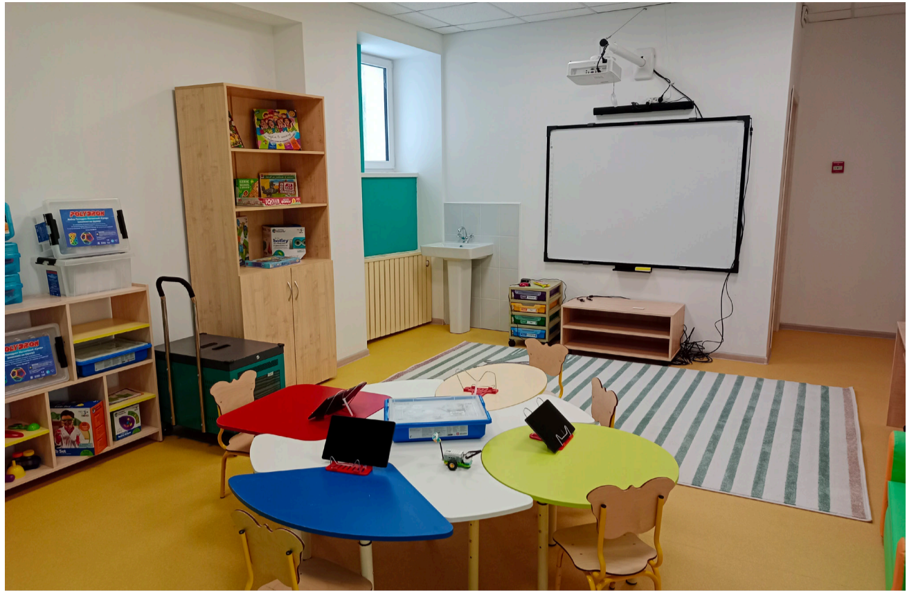
Новые интерьеры детского сада.