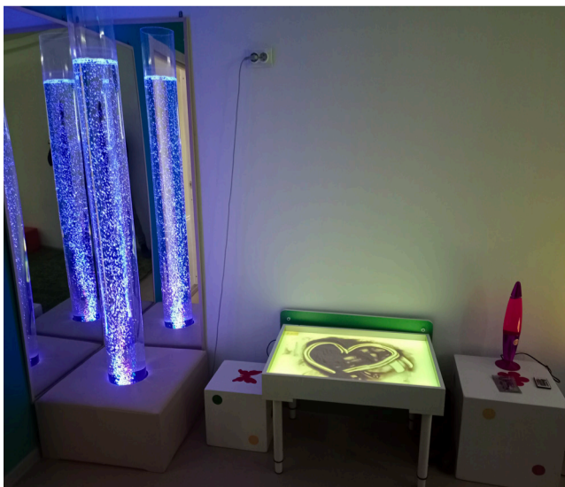
Игровое оборудование никого не оставит равнодушным.