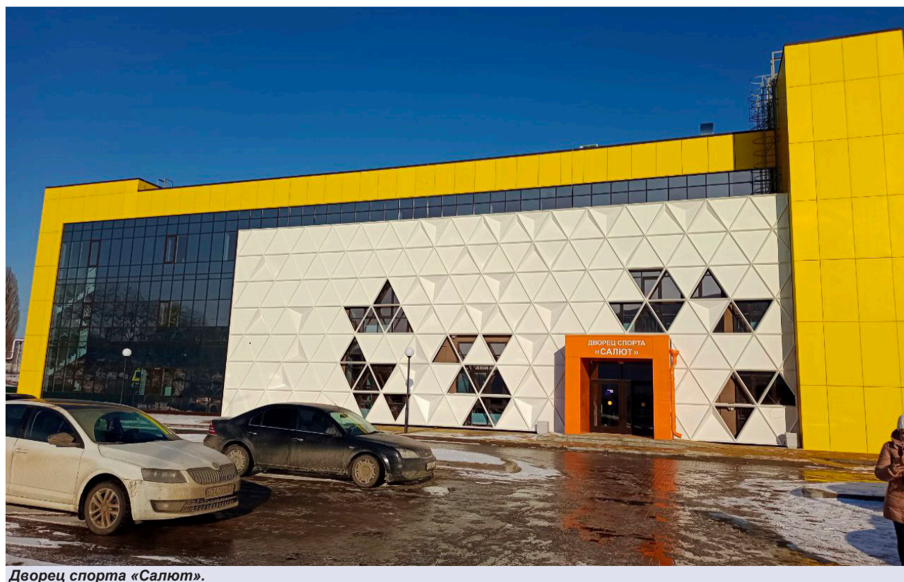
Дворец спорта «Салют».