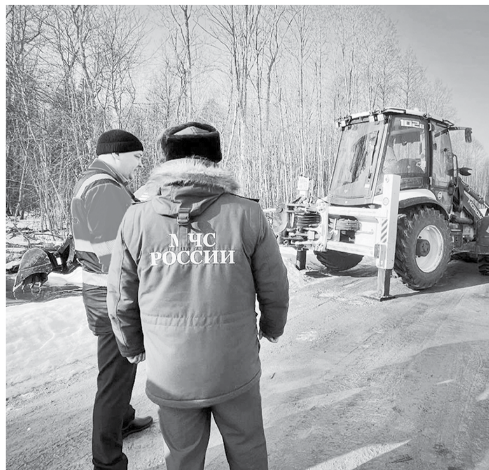
На областных дорогах полным ходом готовятся к половодью

Дорожные службы работают в тесном взаимодействии с территориальными органами МЧС и Гидрометцентром: налажен круглосуточный обмен данными, ве-