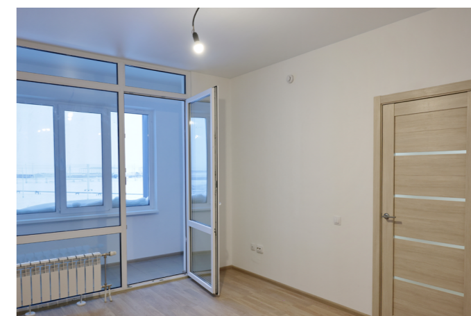
В кухнях и комнатах на третьем и четвёртом этажах лоджии отгорожены стеклянными перегородками

Приборы учёта воды и тепла находятся в отдельном помещении на этаже, все счётчики - с возможностью дистанционной передачи показаний. Строители позаботились о жильцах с ограниченными возможностями здоровья: есть пандус для колясок, тактильное покрытие для слабовидящих, на