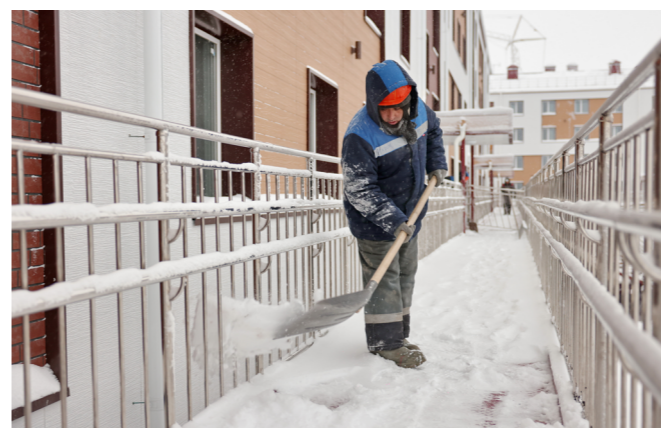
В готовых домах в Солнечном проводятся клининговые работы, ванны там облицованы светлой плиткой, есть полотенцесушители