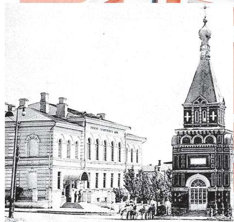
Зданию банка – 125 лет