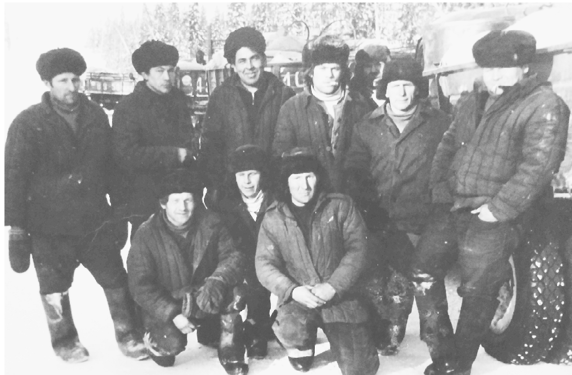
Водители совхоза «Усть-Цилемский». 1980-е годы.

Попытку вырваться из вековой изоляции от Большой земли наши соседи-ижемцы совершили в далёком 1940 году, прорубив просеку длиной 103 километра к железнодорожной станции Ираэль. Война остановила работы, но она действовала. По таёжной дороге, соединяющей промежуточные населённые пункты двух районов, уходили на защиту Отечества устьцилемские призывники группами по 20 – 40 человек. И по ней же возвращались с фронта.