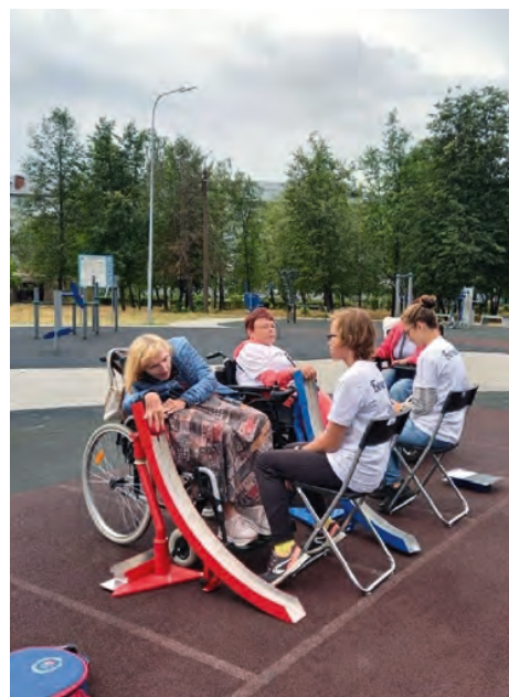
Парк «Радуга», Нижегородская область

Татарстан в числе первых субъектов РФ активно включился в развитие велоинфраструктуры. «Умные» велодорожки Smart Track с сопутствующей инфраструктурой — велосчетчиками, подсветкой, разметкой, СТО — в 2017 году появились в Иннополисе и Альметьевске. Казань, конечно, тоже стабильно расширяет веловозможности для горожан, делая ставку на качественное покрытие и разведение потоков «велосипедист — пешеход» за счет навигации и применения разных дорожных покрытий. Недавно открыт новый участок — вдоль берега р. Казанки между Чашей и Кремлевской Набережной. Судя по отзывам в Сети, велодорожка получилась шикарная.