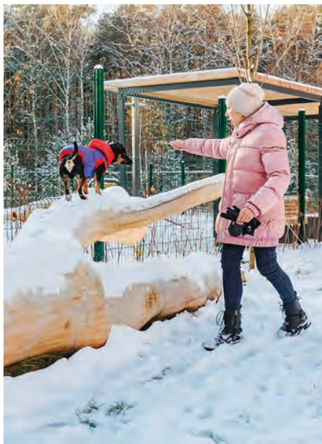
Площадка в ЖК «Мякинино парк», г. Москва

На площади около 0,8 га создано первое в России многофункциональное пространство нового типа для собак и их владельцев. Здесь есть масштаб и простор, что так важно при выгуле и дрессуре животных. Предусмотрены участки, где животное беспрепятственно можно спускать с поводка, давая тем, кто в этом нуждается, побегать вволю. Грамотное зонирование на месте для дрессуры, причем на дрессирующей площадке есть крытый теплый павильон, и игровую территорию с разнообразным оборудованием для игр с питомцем, подходящих для разных пород собак, их индивидуальных особенностей.