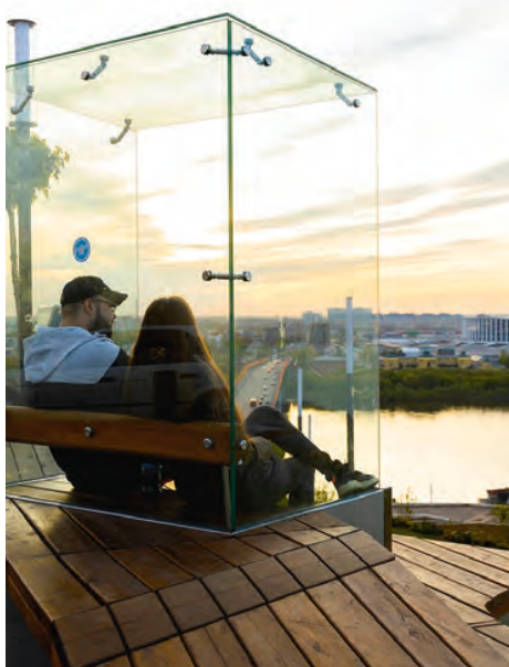
Набережная Федоровского с парком 800-летия Нижнего Новгорода