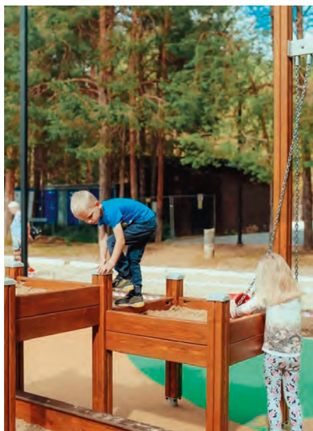
Инклюзивная детская площадка, г. Ухта

В ночное время и вовсе ощущение, что этот пейзаж космический, временно перемещенный откуда-то издалека в нашу стандартную бытовую галактику.