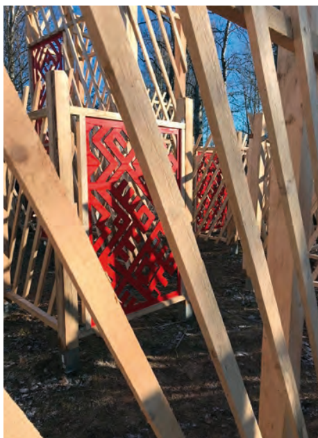
Карельский дом в Чашково, Тверская область