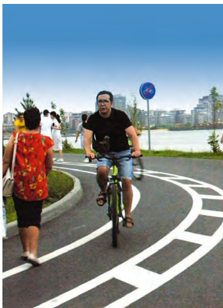
Велоинфраструктура, Республика Татарстан

Пожалуй, это любимое место всех спортсменов и к ним сопричастных из Одинцово. Впрочем, приезжают сюда и жители из других округов МО. Поскольку территория для активного времяпрепровождения подходит идеально. Радует разнообразие направлений и качество задействованного оборудования. Здесь вам возможности для велотренировок, волейбола, для скандинавской ходьбы, тренировок по лыжероллерам. А еще отличная воркаут-площадка с продуманными тренажерами не только для взрослых, но и для детей — бокс и настольный теннис. Особо приятный бонус парка (не только для тела, но и для души) — интересные культурологические маршруты, организованные художниками и скульпторами.