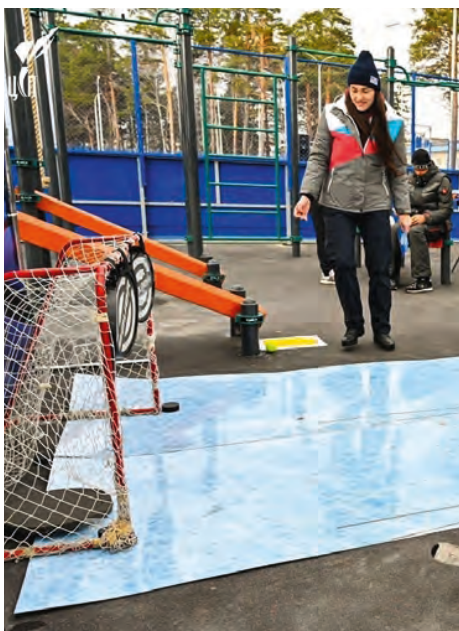
Спортплощадка, Красноярский край

40 «умных» спортивных площадок с цифровыми возможностями открыто в 2022 г. по ФП «Бизнес-спринт».