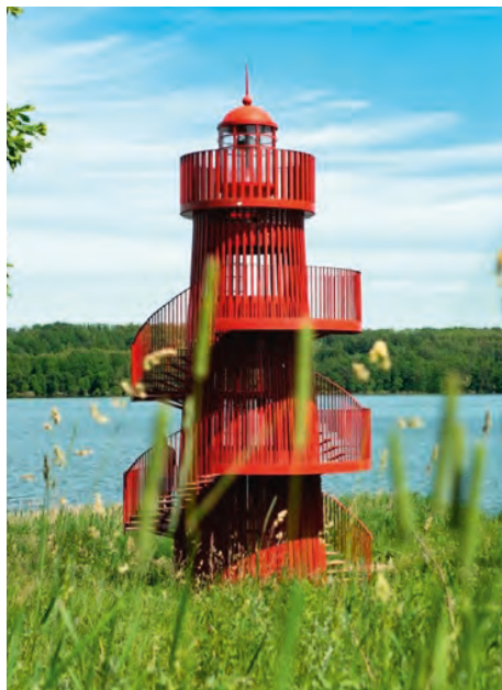
Набережная озера Сенеж, Московская область

Водную гладь озера в Солнечногорске и прилегающий к нему лесной массив архитекторы (бюро Miggog Group) связали эффективными проектными решениями без ущерба экологии места. И более того, учли современные запросы активной части жителей — проложили велопешеходный маршрут, сформировали возможности для динамичного водно-пляжного отдыха, а также не прошли мимо запросов тех, кто больше за тишину. В частности, на месте заброшенного лодочного пирса обустроен пирс для любителей рыбной ловли. Но и в зоне шумной активности тоже предусмотрены локации для созерцания с деревянным подиумом и цветниками околотовных растений.