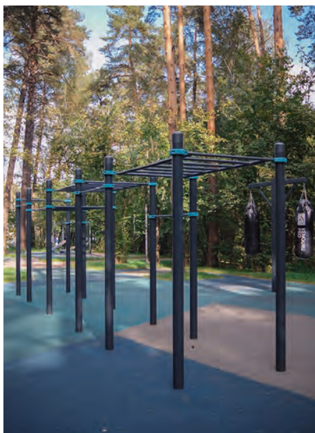
Парк Малевича, Московская область

Пожалуй, это любимое место всех спортсменов и к ним сопричастных из Одинцово. Впрочем, приезжают сюда и жители из других округов МО. Поскольку территория для активного времяпрепровождения подходит идеально. Радует разнообразие направлений и качество задействованного оборудования. Здесь вам возможности для велотренировок, волейбола, для скандинавской ходьбы, тренировок по лыжероллерам. А еще отличная воркаут-площадка с продуманными тренажерами не только для взрослых, но и для детей — бокс и настольный теннис. Особо приятный бонус парка (не только для тела, но и для души) — интересные культурологические маршруты, организованные художниками и скульпторами.