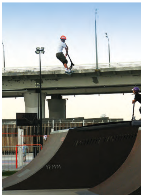
Урам, Республика Татарстан

В Лесосибирске в числе одной из первых появилась «умная» площадка для уличного спорта в череде более чем двух сотен заявляемых к открытию в ближайшие три года в стране за пределами столицы. Помимо разнообразного спортивного инвентаря и локаций для занятий, снаряды для силовой гимнастики, футбол, волейбол, баскетбол, легкая атлетика, а также хоккей и катание на коньках (зимой) — на данной многофункциональной общественной площадке предусмотрено цифровое сопровождение. В частности, перейдя по QR-коду, можно узнать, как правильно заниматься на том или ином тренажере и получить другие дельные спортивные рекомендации.