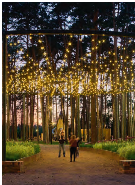
Центральный парк в Заводоуковске, Тюменская область

Детали парка наполнены свойственной только этому месту магией. В основе арт-объектов отсыл к памятнику древнерусской литературы «Слово о полку Игореве» и описанным в нем событиям — их архитекторам (бюро TOU! ARCHITECTS) удалось облечь в захватывающую внимание предметную форму.