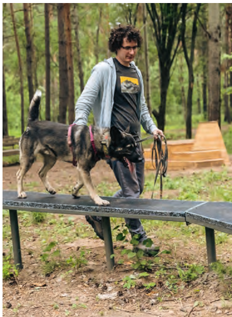
Площадка «Сад собак» в Прибрежном парке, г. Набережные Челны

На площади около 0,8 га создано первое в России многофункциональное пространство нового типа для собак и их владельцев. Здесь есть масштаб и простор, что так важно при выгуле и дрессуре животных. Предусмотрены участки, где животное беспрепятственно можно спускать с поводка, давая тем, кто в этом нуждается, побегать вволю. Грамотное зонирование на месте для дрессуры, причем на дрессирующей площадке есть крытый теплый павильон, и игровую территорию с разнообразным оборудованием для игр с питомцем, подходящих для разных пород собак, их индивидуальных особенностей.