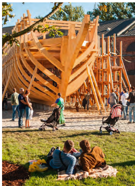
Площадки в Новой Голландии, г. Санкт-Петербург