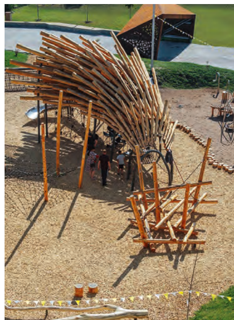
Площадка «Дракон» возле ТЦ «Мега», г. Уфа

Это была и, пожалуй, остается самой масштабной детской игровой площадкой в стране, в которой в том числе предусмотрены возможности для игры детей с ОВЗ. Территория лазанья — прыгания — тактильного познания и прочих развлечений занимает около 2 гектаров. Здесь девять индивидуально спроектированных пространств (компания «Александр Фронтов и архитекторы») с разными материалами — песком, водой, акустическим и визуальным разнообразием, богатством форм и фактур. Громоздкие мегакачели из 29 элементов, водная станция для покорения и изучения водной стихии и лазательный комплекс. Тот самый пример ДИП, где интересно даже взрослым, а детям всех возрастов тем более.