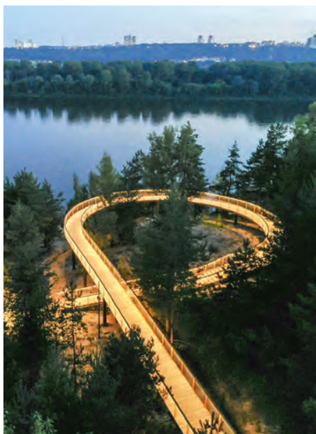
Моховые горы, Нижегородская область

Вековые сосны вдоль Волги в г. Бор — само по себе прекрасное прогулочное созвучие. Но благоустройство (архбюро «ГОРА») этому месту пошло в 100-процентное благо, поскольку продумано с тончайшей деликатностью к окружению. Смотровая площадка пластикой конструкции уведит посетителей к вершинам деревьев, разнообразное освещение — одни, как полная луна, другие, как светящийся пенек; вспыхивающие над головами каскадом звезд цитаты из творчества Горького и Шалапина, амфитеатр как продолжение жизни леса... Здесь гуляется с комфортом, как в сказочном лесу, где хочется придумать на ходу собственные творческие истории.