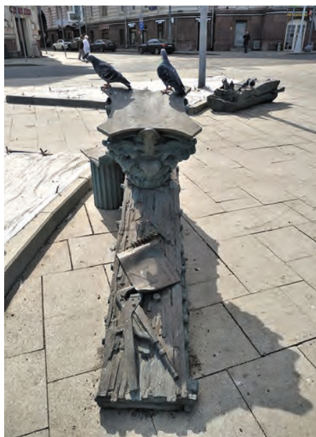
«Научные» скамейки на Сретенском бульваре, Москва

Качели, на которых можно запросто кататься и взрослым, все шире охватывают общественные пространства благоустройства нового типа. Их, как правило, устанавливают на площадях и в парках крупных городов, а также на набережных и других природных локациях. Тенденция так благодарно пошла в народ, что среди качающихся часто можно встретить и молодежь, и пенсионеров. В данном виде МАФов из материалов доминируют дерево и металл. Чаще можно встретить светящиеся качели, как, например, на многофункциональной площадке в Новом Уренгое. То, что такой вид установлен в междворовом пространстве, пока скорее редкость, чем обыденность.