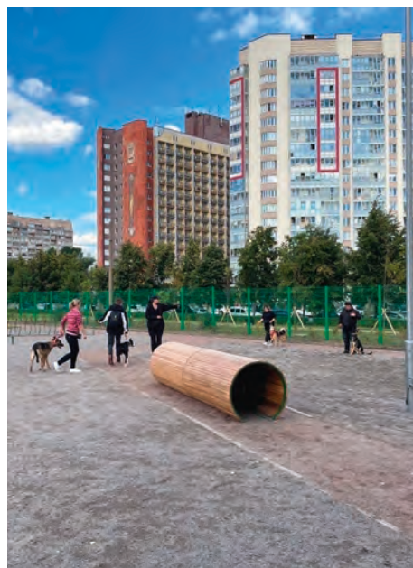
Площадка в Полюстровском парке, г. Санкт-Петербург

Особенно хороша тем, что расположена в зеленой зоне. Застройщик («Атомстройкомплекс») расположил площадку в относительном отдалении от домов, интегрировав ее в находящийся на территории участок соснового леса. В качестве основного покрытия на площадке, спроектированной в форме треугольника, использовали песок, на котором разместили достаточное количество разных снарядов. Есть здесь для собак и кольцо, и балансир, а также бревно, горка. Площадка огорожена. Закрывается изнутри. Так что четвероногую питомца можно спокойно спускать с поводка побегать и порезвиться.