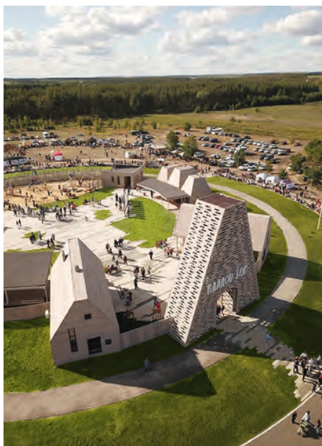
«Каялов Бор», Воронежская область

Вековые сосны вдоль Волги в г. Бор — само по себе прекрасное прогулочное созвучие. Но благоустройство (архбюро «ГОРА») этому месту пошло в 100-процентное благо, поскольку продумано с тончайшей деликатностью к окружению. Смотровая площадка пластикой конструкции уведит посетителей к вершинам деревьев, разнообразное освещение — одни, как полная луна, другие, как светящийся пенек; вспыхивающие над головами каскадом звезд цитаты из творчества Горького и Шалапина, амфитеатр как продолжение жизни леса... Здесь гуляется с комфортом, как в сказочном лесу, где хочется придумать на ходу собственные творческие истории.