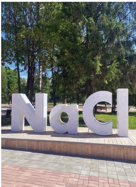
Соляной сад, Вологодская область

Данная общественная территория в городе Череповце особенно ценна тем, что в процессе благоустройства ей постарались вернуть историческое соотношение между рекреационной и развлекательной зоной — 70% на 30%. Для достижения этих целей было высажено не менее 2 тыс. различных деревьев и кустарников, расширился флористический ассортимент. В саду до благоустройства произрастало 47 видов растений, после — 65 видов. И вот уже это пространство все ближе и ближе к категории «дендропарк», в котором при этом не исчез функционал развлекательных активностей. Природа вернула свое — быть первой и главной героиней благоустроенной территории.