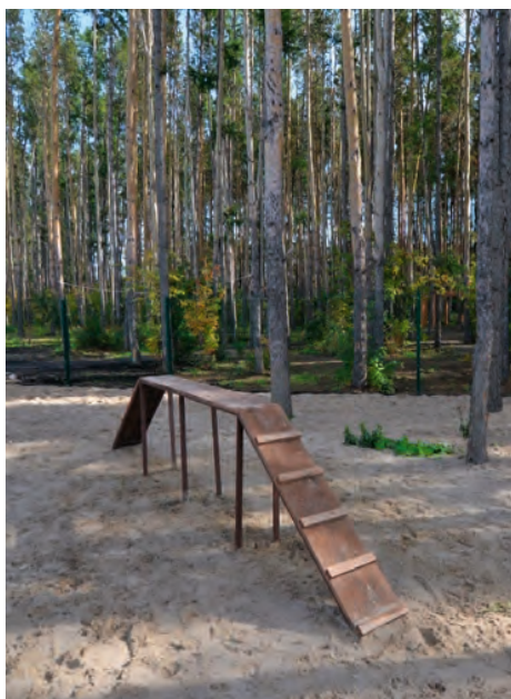
Площадка в ЖК «Woods. Дома в парке», г. Екатеринбург

24% — рост владельческих собак с 2017-го по 2022 г. (исследование Ipsos совместно с Mars Petcare).