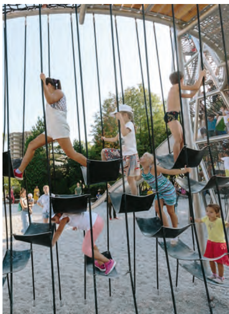
«Салют» в парке Горького, г. Москва