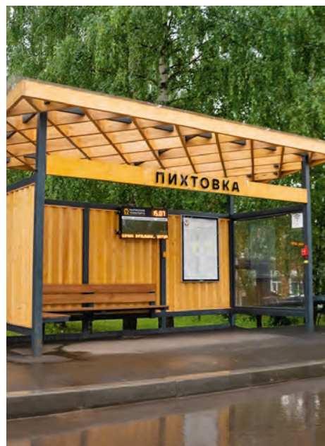
Остановочный комплекс, дер. Пихтовка

Проектные решения сделали эту территорию важной точкой в панораме Нижнего и опорным пунктом любования старым городом и речными пейзажами. Разнообразие МАФов, коих по группам здесь несколько десятков, помогает в решении прикладных задач (для игр и прогулок, для семей, спортсменов, детей, собаководов, романтических пар и т.д.) и тематически-эстетических. Например, каскадная инсталляция программируемых светильников: она может превратить заход солнца в световое представление. Или беседки: примененный материал — закаленное стекло — позволяет человеку, даже находясь в «укрытии», не выпасть из контекста природы.