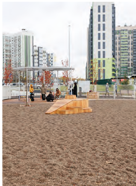
Площадка в ЖК «Салават Купере», г. Казань

Похоже, создавать интересные площадки для выгула собак на территориях ЖК превращается в тенденцию. По крайней мере в столице России. Один из таких примеров — данная территория (застройщик — ГК «ПИК»). Продумано и для четвероногих, и для их владельцев. Для собак — игровые тренировочные снаряды: можно бегать, перепрыгивать без опасения врезаться в чересчур близко расположенное ограждение, пролезать через тоннели, а можно неспешно ходить, например, по специально установленному бревну. Для людей — зона отдыха со скамейками с навесами, защищающими от осадков, проложенные дорожки и прочие удобные мелочи.