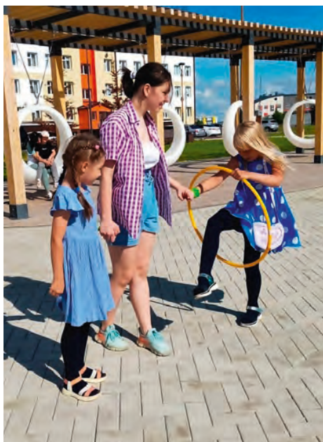
Многофункциональная междворовая площадка «ТутоКруто», Новый Уренгой

Качели, на которых можно запросто кататься и взрослым, все шире охватывают общественные пространства благоустройства нового типа. Их, как правило, устанавливают на площадях и в парках крупных городов, а также на набережных и других природных локациях. Тенденция так благодарно пошла в народ, что среди качающихся часто можно встретить и молодежь, и пенсионеров. В данном виде МАФов из материалов доминируют дерево и металл. Чаще можно встретить светящиеся качели, как, например, на многофункциональной площадке в Новом Уренгое. То, что такой вид установлен в междворовом пространстве, пока скорее редкость, чем обыденность.