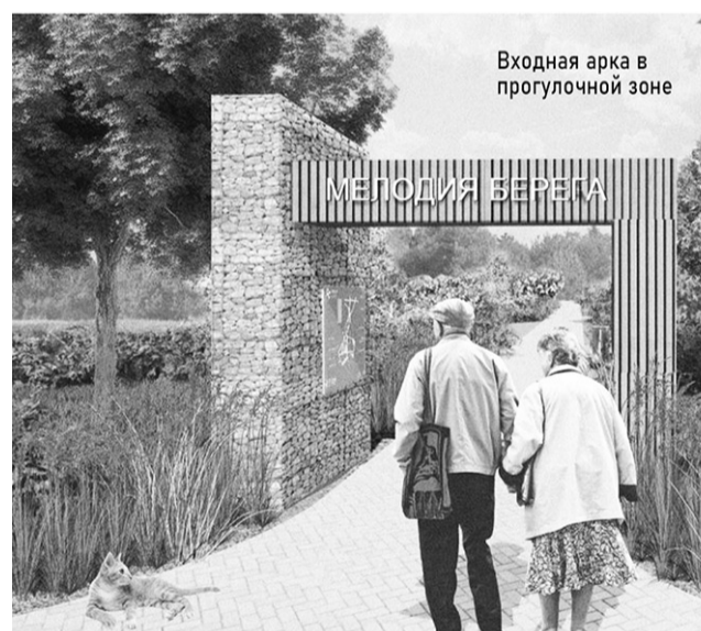
Входная арка в прогулочной зоне

– Участниками онлайн-голосования могут стать жители в возрасте от 14 лет. Могу сказать, что молодые люди довольно активно голосуют, особенно спортсмены. Мы, волонтеры, проводили онлайн-голосования в школах и во время праздничных мероприятий, посвящённых 80-летию Великой Победы. Иногда нас приглашают