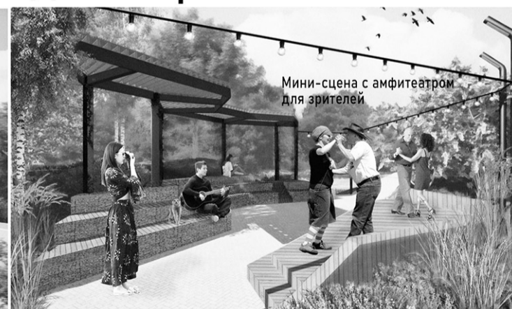
Мини-сцена с амфитеатром для зрителей

Проект № 1. «Мелодия берега» предполагает видовую площадку с кинетической скульптурой, которая движется от ветра, как своеобразный флюгер, просторную детскую площадку для подвижных игр для младшего детского возраста, а также в низине расположена площадка для танцев в виде мини-сцены и амфитеатра для зрителей, прогулочные дорожки и скамейки. Проект также предусматривает индивидуальную входную зону из габионов с названием общественного пространства.