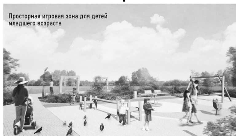
Просторная игровая зона для детей младшего возраста