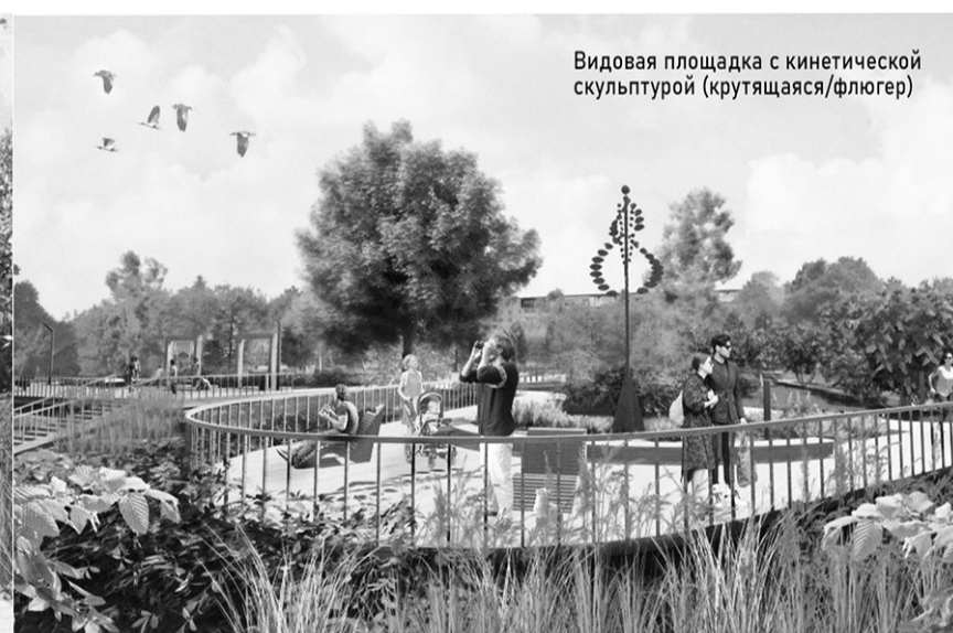
Видовая площадка с кинетической скульптурой (крутящаяся/флюгер)