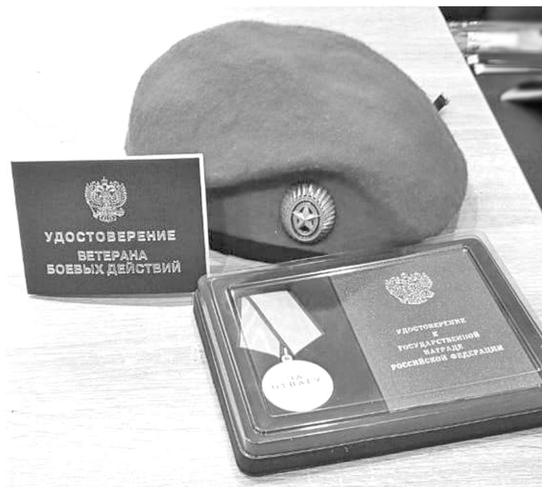
Боец имеет награды.

территории. ВСУшники, конечно же, атакуют. Мы держимся! Русские не сдаются!