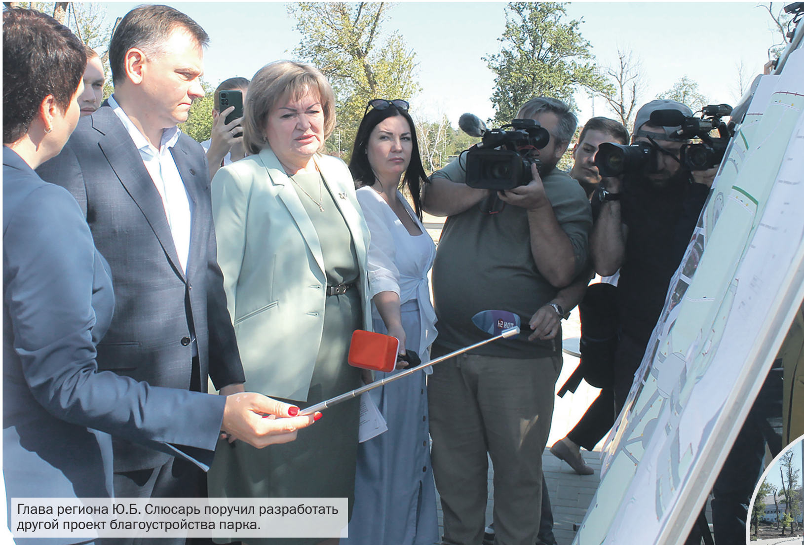
Глава региона Ю.Б. Слюсарь поручил разработать другой проект благоустройства парка.

Глава региона подверг резкой критике подход к благоустройству, которое начали с вырубki деревьев, поручил скорректировать проект - восстановить исторически существовавший здесь водоем и увеличить площадь зеленых зон с высадкой деревьев и кустарников.