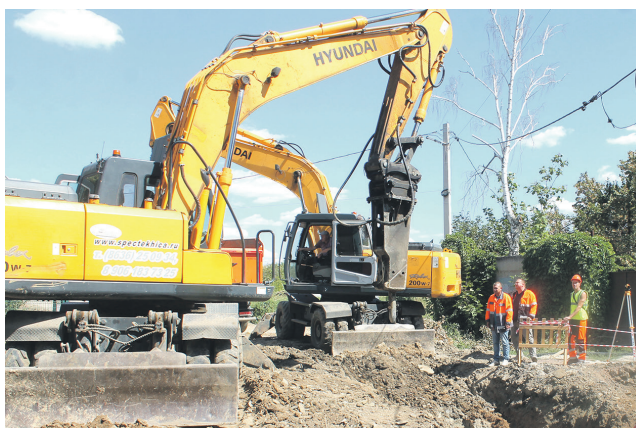
Планируемый срок завершения работ в пос. ХБК - сентябрь 2025 года.

1800 человек работает в компании «Авангард» в Шахтах