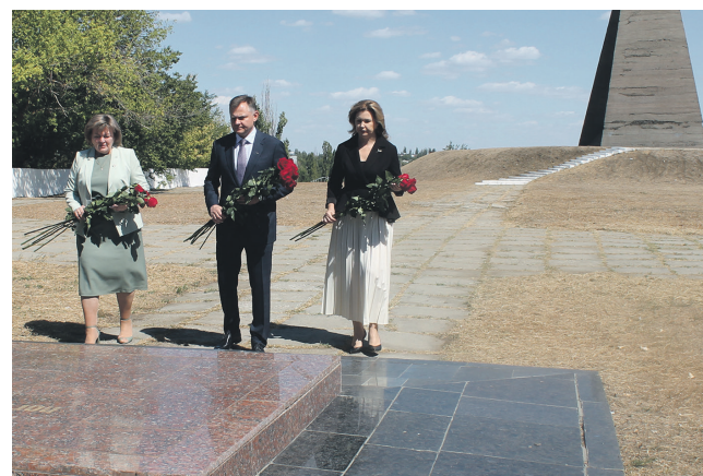
На мемориальном комплексе восстановят стену захоронения, надгробную плиту и скульптурную группу.