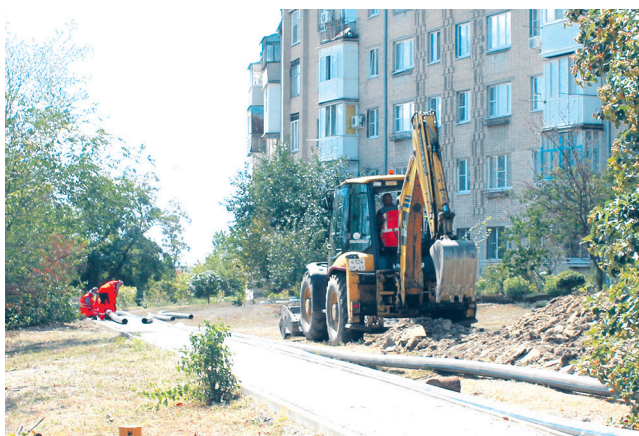
На ХБК ведется замена 450 метров труб и строительство девяти колодцев.