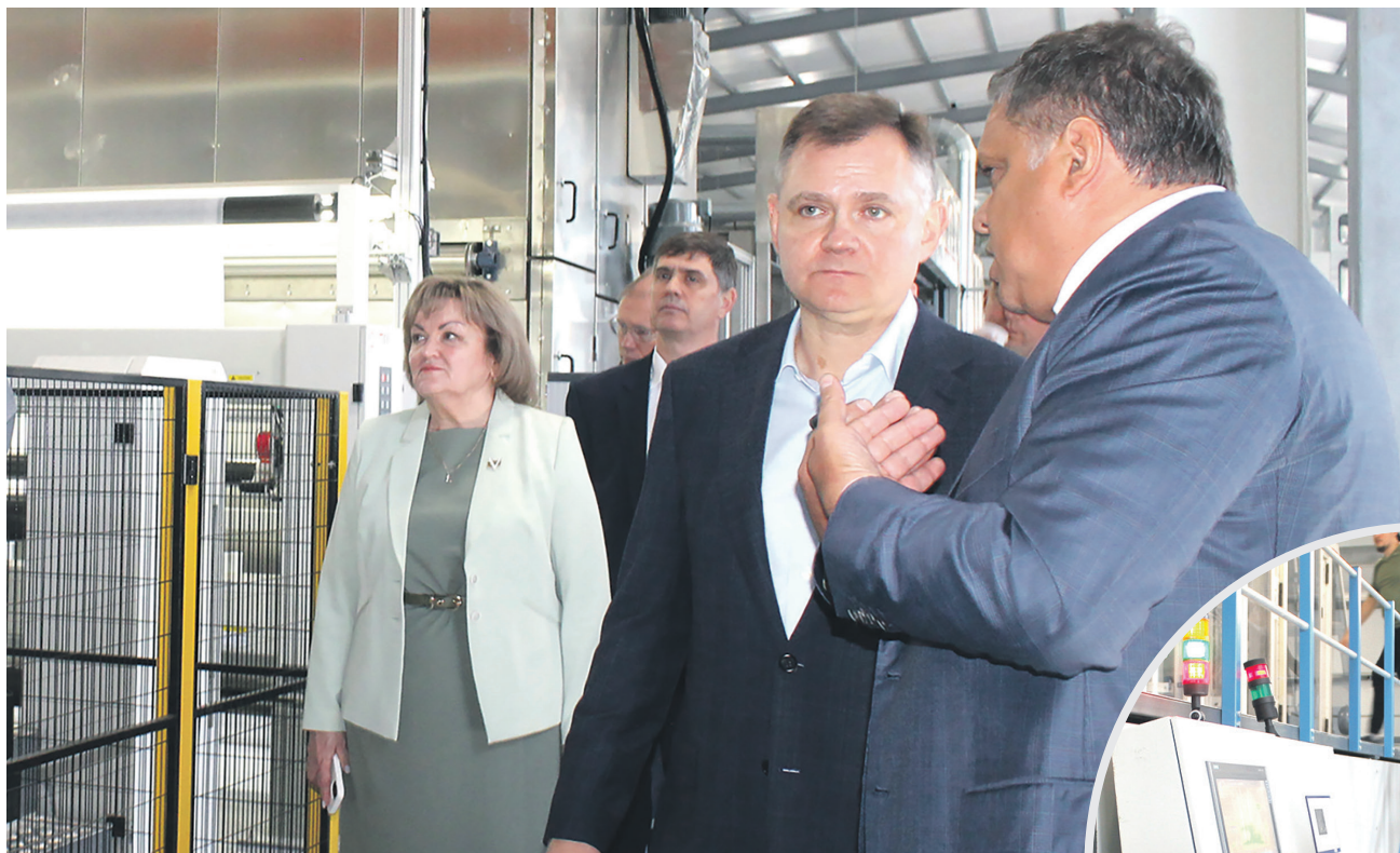
«Авангард» запустил новую производственную линию и современный логистический комплекс.

Реализация инвестиционного проекта стоимостью 1,4 миллиарда рублей, направленного на создание логистического комплекса и оснащение трех производственных цехов, стартовала в 2023 году при поддержке Фонда развития промышленности, предоставившего около 300 миллионов рублей. Ввод в эксплуатацию новых цехов позволит увеличить выпуск влажных салфеток и нетканого материала спанлейс из полиэфирного волокна. С запуском логистического комплекса пред-