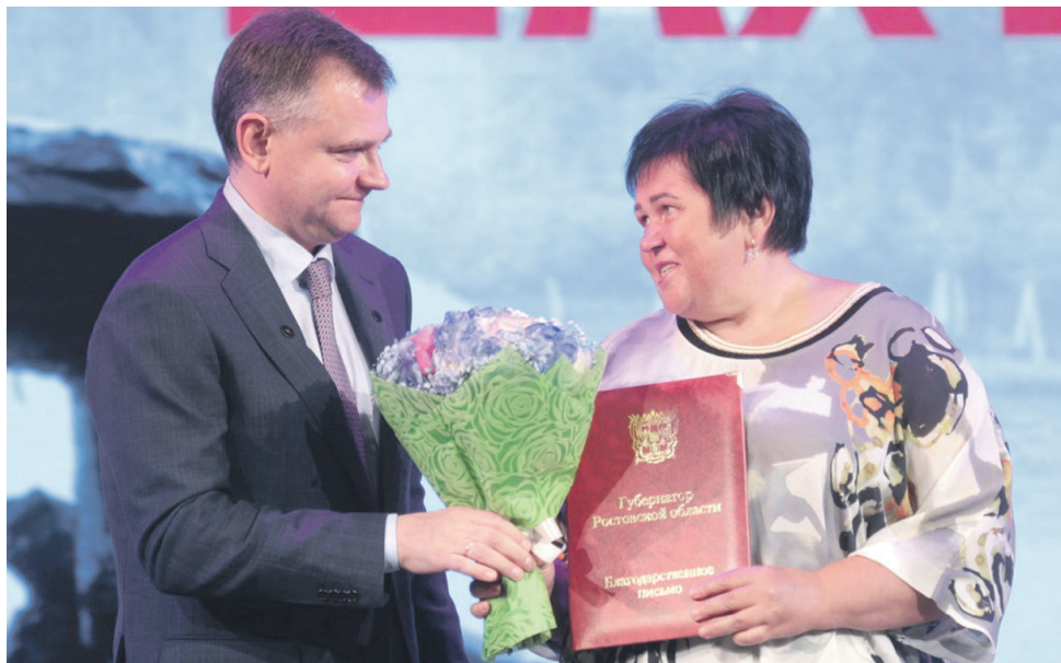
Десять горняков на торжественном собрании получили областные награды и поощрения.

приятие завершило формирование полного производственного цикла на шахтинской площадке.