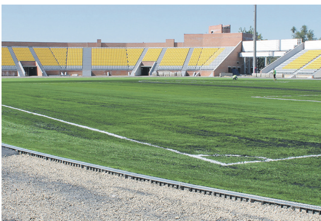
В ходе реконструкции стадиона выявлены значительные объемы дополнительных работ.